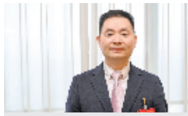
省政协委员,省大型海洋潮流能工程研究中心主任、总工程师 林东