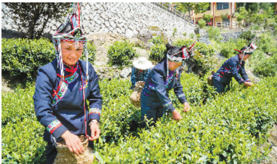
景宁畚族茶农在采茶(资料图)。