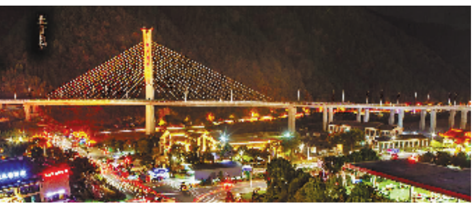
景宁高架桥夜景 邱文俊供图

素有“九山半水半分田”的景宁、文成两县,境内河谷纵横、群峦起伏,平均海拔近500米。长期以来,大山峡谷阻隔,交通不便,百姓出行困难,极大地制约了当地经济发展。在连绵的大山间开辟高速,成为了浙南人民的殷切期盼。