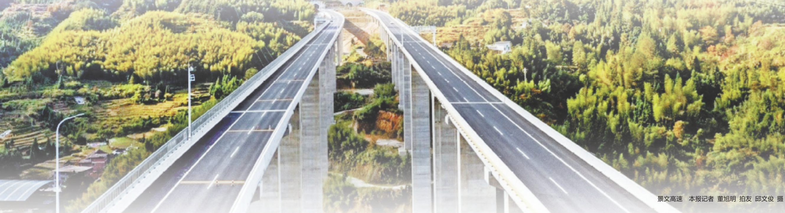
景文高速

1月4日,景文高速建成通车。作为龙丽温高速和国高网深宁高速浙江境内最后一段,景文高速横贯浙南山区,连接起浙江山区26县中的景宁和文成。