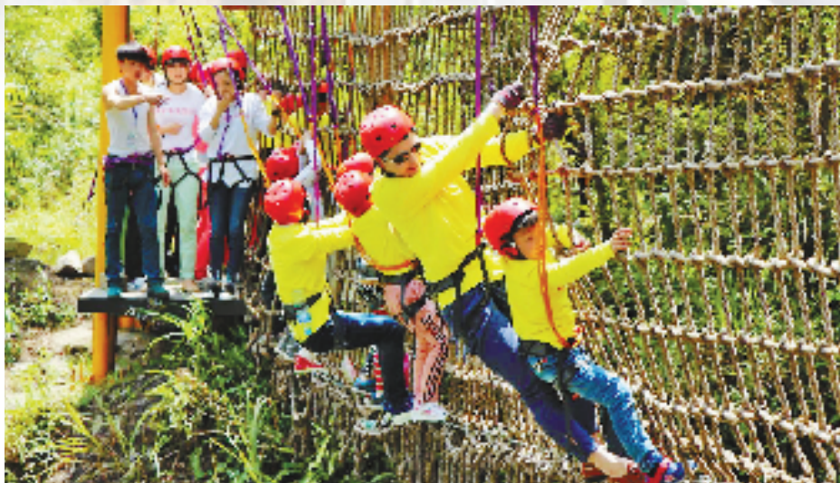
游客在文成体验乡村旅游。

2020年初和年底,龙丽温高速公路文成至瑞安段、文成至泰顺段正式通车,文成、泰顺自此迈入了“高速时代”,浙江由此实现陆域县县通高速。而景文高速开通,则彻底打通了龙丽温高速。