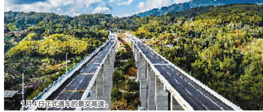
1月4日正式通车的景文高速。

景文高速建成通车,历时20年的龙丽温高速建设画上最后一笔 浙西南山区全面融入高速路网