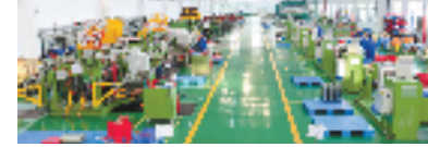
小微企业园入园企业