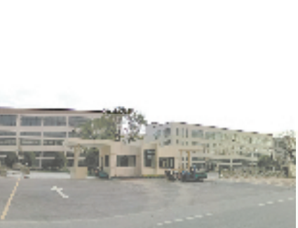
小微企业园

综合实力逐年稳步提升,建德经济开发区位列全省开发区综合排名第20位,已经成为浙西地区工业经济、特色产业重要增长极。在奋进共同富裕的道路上,开发区将以党建为引领,狠抓优质项目招引与平安法治建设,加快推进传统产业转型升级,积极培育发展新材料、新能源、生物医药、通用航空等新兴产业集群,努力激发开发区高质量发展的新活力、新动能、新优势,力争为建德经济发展稳进提质作出更大贡献。