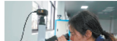
企业创新实验室研发人员