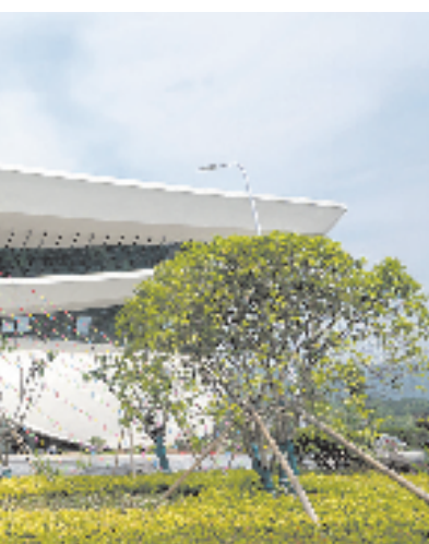
建德千岛湖通用机场航站楼

在花园式的马目智能园区,依托科学布局及智能化场景应用,园区实现了在线监控,废水减排40%,用实际行动践行“不让一滴污水入江”的承诺……依托应急指挥平台,可以实时获取园区企业的安全环保相关的动态过程数据和视频监控信息,结合预警评估模型,实现“两重点一重大”数字化管理和应