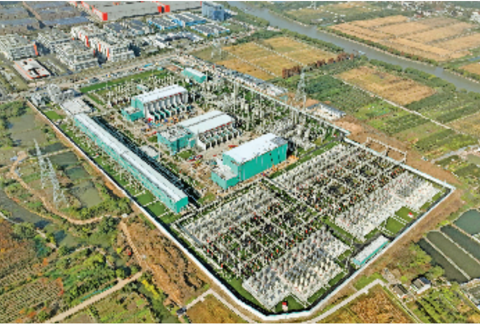
白鹤滩—浙江特高压工程浙北换流站(资料照片)。