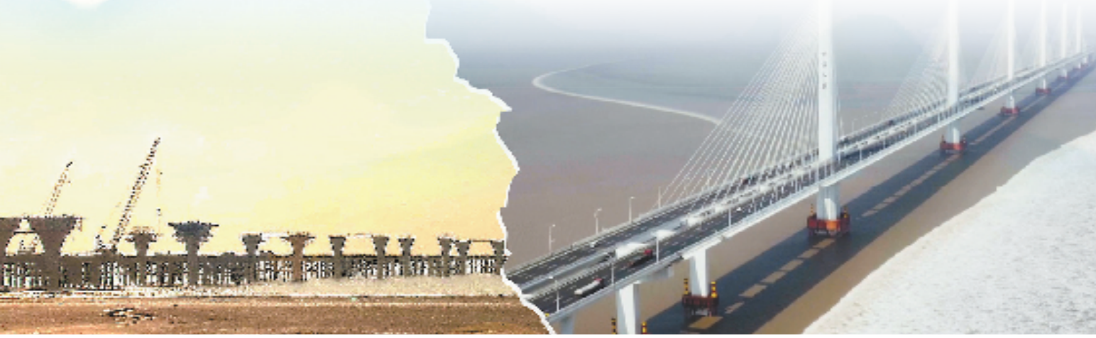
2011年,建设中的嘉绍大桥。

“一核心、两围绕”是助推黄湾镇域经济走向高质量、绿色发展的牛鼻子,也是其深入贯彻国家促进经济高质量发展战略的具体体现。厚积薄发之功,始得非凡十年。未来,相信沿着这条绿色低碳可持续发展的路子,定将为黄湾镇在高质量发展的新征程上提供强有力的支撑,让更多居民走进绿色生活并从中受益。