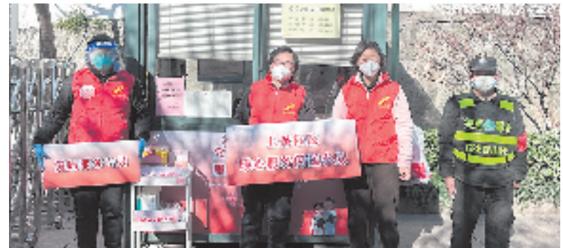
“暖心小屋”传递温暖与力量

“快速响应、极速送达”是上保暖心小分队的口号，第二网格员小宋，在得知家住体育场路的孤寡老人陈