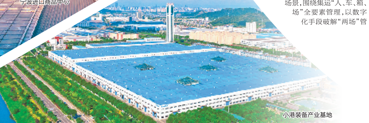
小港装备产业基地