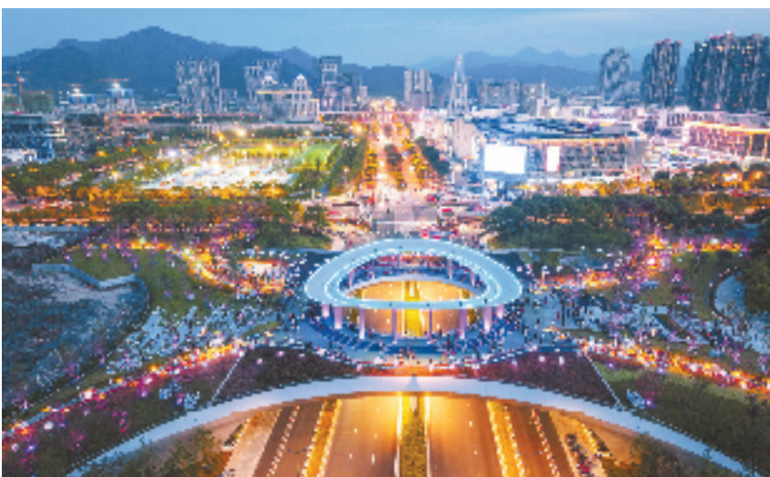
“风环巢”夜景

江新城、梅山湾新城、集成电路产业平台、“246”产业示范园等重大区域平台，做深做实项目谋划储备，仅今年就相继推动31个重点项目落地，总投资超1300亿元；同时，研究出台《北仑区（开发区）促进产业高质量发展扶持办法》《北仑区（开发区）优化要素资源配置促进稳商扩资增效扶持办法（试行）》，谋划实施30多个稳商扩资项目。