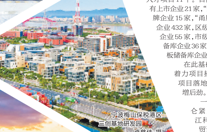
宁波梅山保税港区三创基地研发园