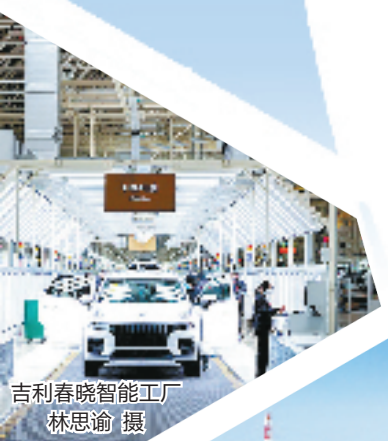
吉利春晓智能工厂

北仑区委主要负责人表示，下一步，北仑将着力深化铸魂溯源、产业升级、改革创新、开放先行、空间重构、全龄友好、智慧善治、固本强基，为浙江推进“两个先行”，为宁波建设现代化滨海大都市，贡献更多北仑力量。