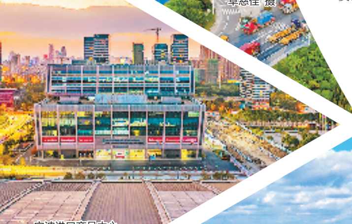
宁波进口商品中心