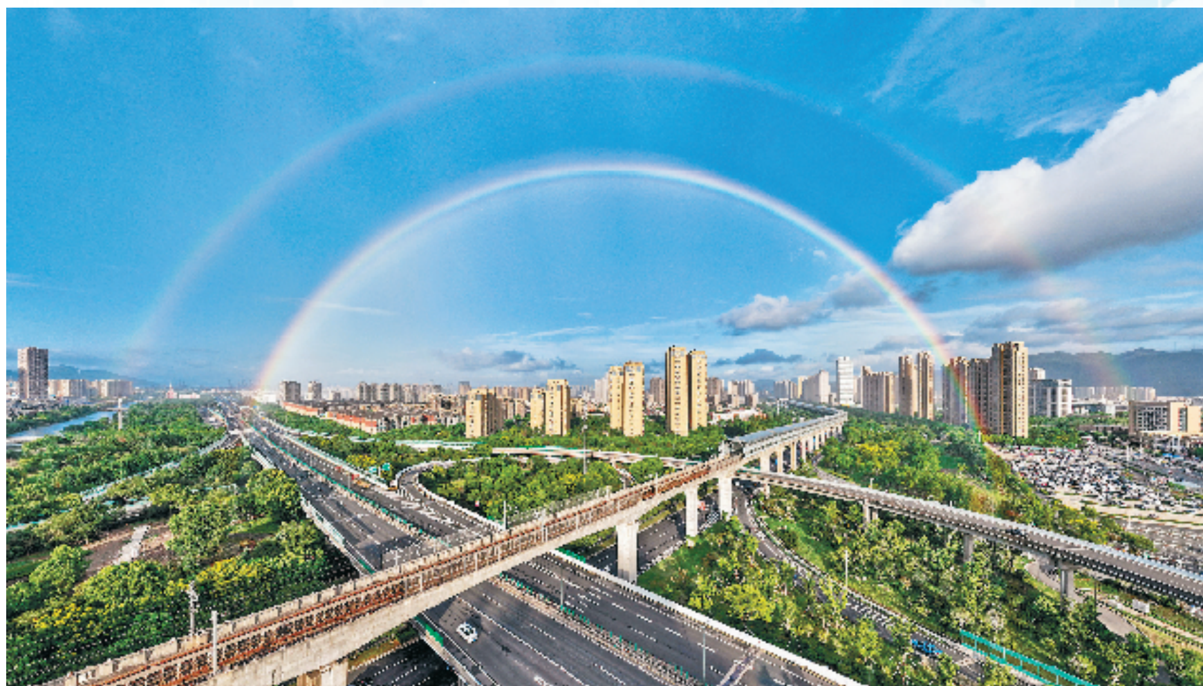
祥和的港城

未来，北仑将坚持系统观念，强化统筹联动，紧扣“六促六优”，开建设现代化滨海大都市高能门户崭新局面，奋力打造中国式现代化港城示范区。