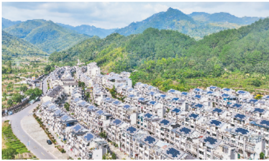
海曙区龙观乡李岙村