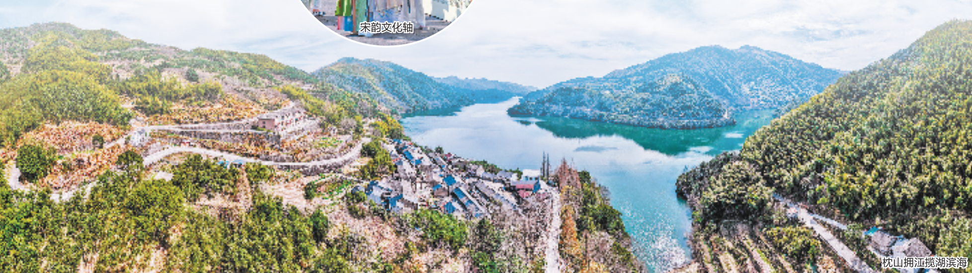
沈山拥江揽湖滨海