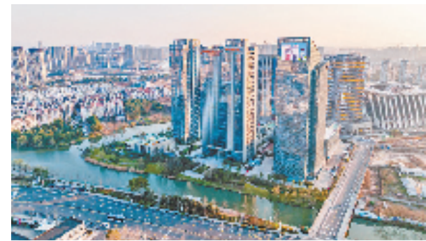
工业互联网研究院

秉承“红色引领”理念，助力革命老区振兴。海曙通过红色地标彰显、旅游产品设计，积极推进一镇一品建设。章水镇举办贝母文化节、樱花节、“四明问秋”国际越野赛等节庆活动，打造红色旅游融合发展标杆地；鄞江镇打造建蚕妈妈农场、红色研学线、红色剧本杀等兼具教育意义和市场化的文旅项目，推动村集体就业、收入增长，助力革命老区实现“千年古城”复兴。