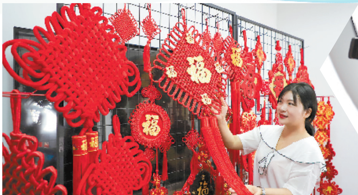
加入“多多新匠造”计划，中国结迎来出村进城大好时机。

番市场调研，最终让她下定决心的，是“放不下这门手艺”，虽千万人吾往矣：“就像一碗家常面，用家里的炊具才最美味，外头再先进的大锅，都做不出那样的滋味。”