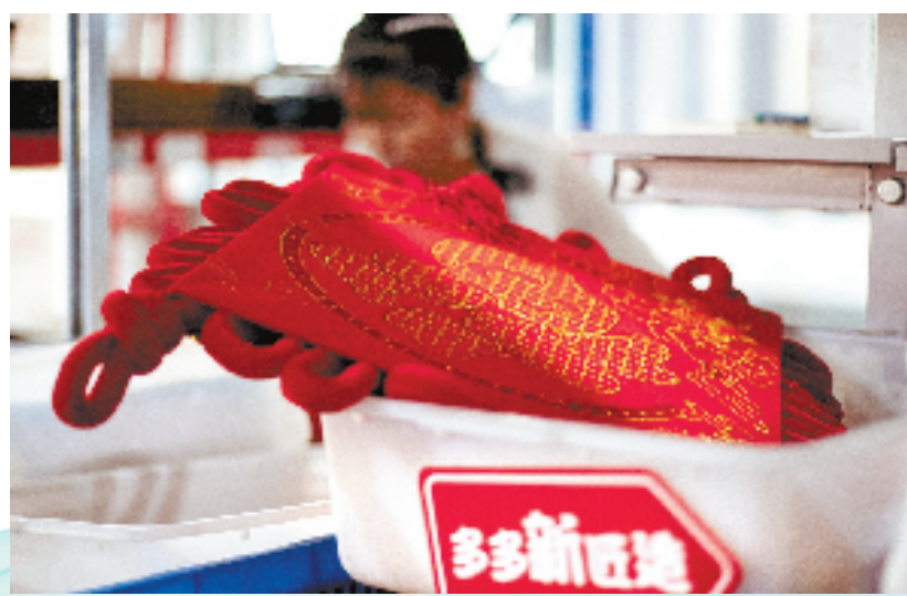
东阳市画水镇生产的“中国结”迎来销售旺季

国结的出场。如北京冬奥会上，由数字AR技术生成的中国结，凝结在“鸟巢”上空，每一根丝带既独立成结，又互相交织，展现着“中国式浪漫”。