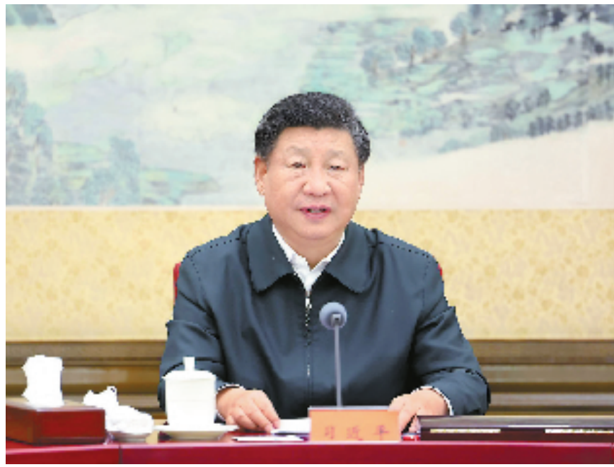
12月26日至27日,中共中央政治局召开民主生活会,中共中央总书记习近平主持会议并发表重要讲话。