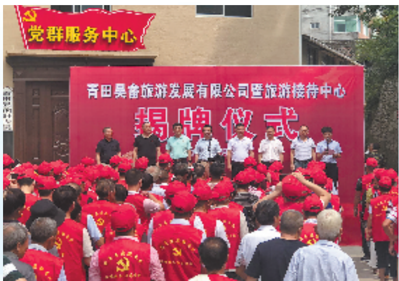
2019年6月,天通党委与青田县祯旺乡吴畲村举行青田吴畲旅游发展有限公司暨旅游接待中心揭牌仪式

每一个时代都有企业家的责任。当前,我国迈上全面建设社会主义现代化国家新征程,天通将继续积极投身乡村振兴,为高质量发展建设共同富裕示范区作出更大贡献。