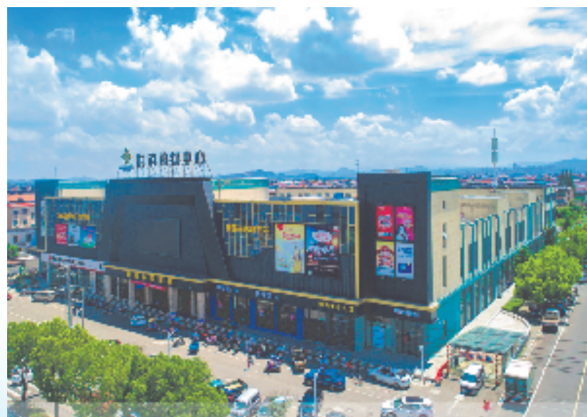
上虞区供销社购物中心