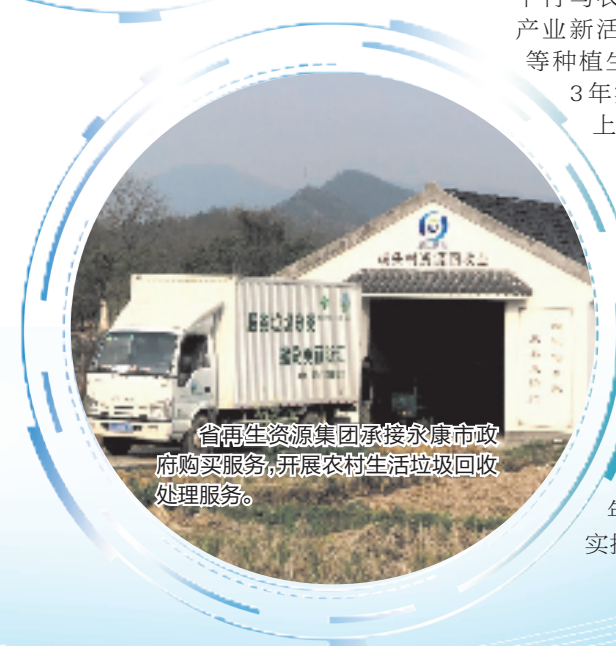
省再生资源集团承接永康市政府购买服务,开展农村生活垃圾回收处理服务。