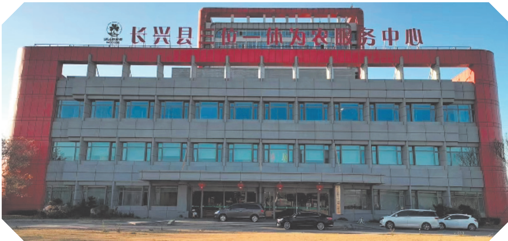
长兴县三位一体为农服务中心