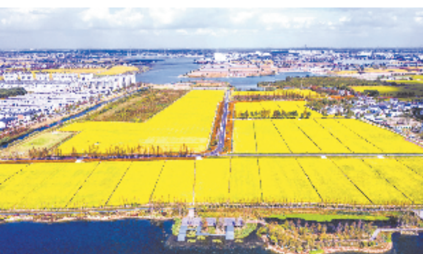
浙农现代农业公司在嘉善的首个万亩种植项目

今年1—11月全系统实现总经营收入4799.3亿元,同比增长9.1%。各类法人企业总数达到1112家。全省供销社拥有各级政府认定的龙头企业221家、销售额亿元以上企业230家。兴合集团迈上千亿规模,浙农股份成功登陆A股市场。全省培育建成20强县县级供销社、53个百强基层供销社,85个基层供销社完成“消薄”任务。