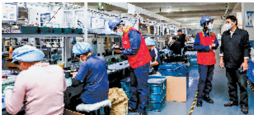
宁波供电开展“千企走访”活动

岁末年初,国网宁波供电公司全力做好迎峰度冬电力保供工作,截至11月底已累计实地走访服务企业1200余家,电力宣传覆盖企业超3000家,收集并解答企业各类电力诉求200余件。