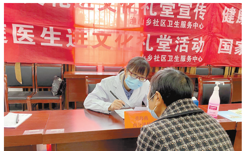
富阳中医院爱心义诊队开展义诊活动

更近了,感情更深了。”渔山乡政协委员履职小组负责人介绍,除“中医院爱心义诊”这项针对老年人的服务内容外,面向儿童制定了“‘小渔儿’成长关爱计划”,希望建立长期帮扶机制,让这些家庭困难的儿童也能健康快乐地成长。此前,渔山乡政协委员履职小组逐一联系了“小渔儿”的家长,详细了解孩子的微心愿,政协委员一对一帮助困境儿童圆梦,不仅给孩子们带去新玩具、新书包、运动鞋等礼物,还祝福孩子们要努力学习、健康成长、勇敢追梦。 目前,政协委员已经通过上门走访,和“小渔儿”亲切交谈,认真倾听和记录每一位“小渔儿”的学习情况、家庭情况、成长需求,建立并完善了个人档案。同时,政协委员也在积极谋划,组织形式更加丰富的集体活动和一对一关爱活动,提供更多精神层面的帮扶。 接下来,渔山乡政协委员履职小组将全面摸排全乡残疾老人、特困老人、低保老人、空巢老人、计生特殊对象、困境儿童等群体情况,通过“全面覆盖+精准画像”,建立“一老一小”专项服务台账,加大一对一关怀力度,提升百姓的获得感、幸福感、安全感。