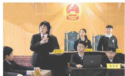
今年11月,“海法护航”团队法官指导学生进行模拟庭审。

2020年,海曙法院转变思路,创新线上普法教育平台,与宁波市中院联合出品了一款微信小程序——海法学苑,用户可以浏览与未成年人相关的法律知识、经典案例、普法视频,并能参与有奖互动游戏。“海法学苑”微信小程序具有易获取、体验轻便、无需安装等特点,能够更好地展示和宣传未成年人普法宣传工作。 今年,“海法护航”青少年普法教育基地落成,总面积300多平方米,打造了智能阅读、法治考场、模拟法庭等多个应用场景,先后邀请1000余名青少年“沉浸式”体验法治课堂,已经成为海曙区关心下一代教育基地。 创建6年多来,“海法护航”已先后走进宁波50多所学校,开展线上、线下普法宣传活动100余场,参与学生上万人次,发放宣传品1万多份。 萤火之光,可照“野”。“海法护航”愿做法治灯塔,传递未成年人司法保护的温度和力量。