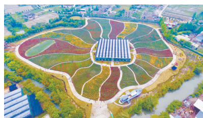
台州花木城七彩花田

优惠价格出让给全区26个低收入村,花木城代为经营,每年支付该村3万元作为助富红利,壮大村集体经济。” 此外,峰江街道乡贤联谊会用好新乡贤带富基金,针对辖区群众就业技能提升和服务共富工坊建设需要,联合推出了“贤来助”共富系列职业技术培训。 目前,乡贤带富基金已用于慈善公益事业达300万元,帮助困难群众200余人次。