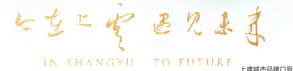
上虞城市品牌口号

“遇见未来”则表达期盼未来的美好愿景,符合上虞打造青春之城的城市定位,彰显了朝气蓬勃、近悦远来的城市品质,让历