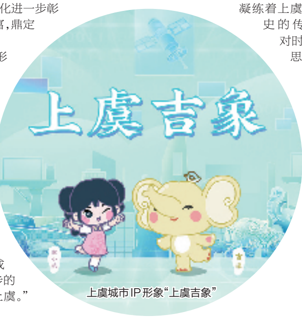
上虞城市IP形象“上虞吉象”

“今在上虞,遇见未来”,正是将历史文化与未来愿景融为一体,穿越时空,意蕴深远。城市的品牌形象,关系到城市的吸引力、竞争力、辐射力,关联着群众的获得感、幸福感、安全感。上虞的现在是全体上虞人民拼出来、干出来、奋斗出来的,上虞的未来也是上虞人民期盼的未来。今天的上虞,将擦亮王羲之“今在上虞”4个大字,让上虞在高质量发展的前行路上,打响上虞独具魅力的城市品牌,让上虞信心百倍、充满激情“遇见未来”。