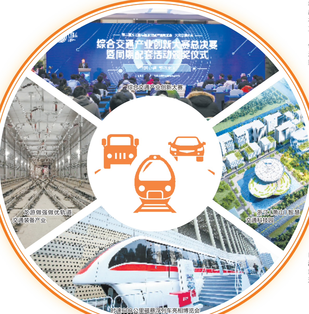
综合交通产业创新大赛

截至目前,全省综合交通产业相关企业约3.7万余家(注册资本1000万元以上),上市企业60余家,年均增长率分别达5.0%、7.3%。其中阿里巴巴、吉利多次入选世界500强企业名单,浙建集团、浙江交工等企业入选2021年ENR承包商250强,传化、海康威视等入选2021浙江省制造业百强企业。