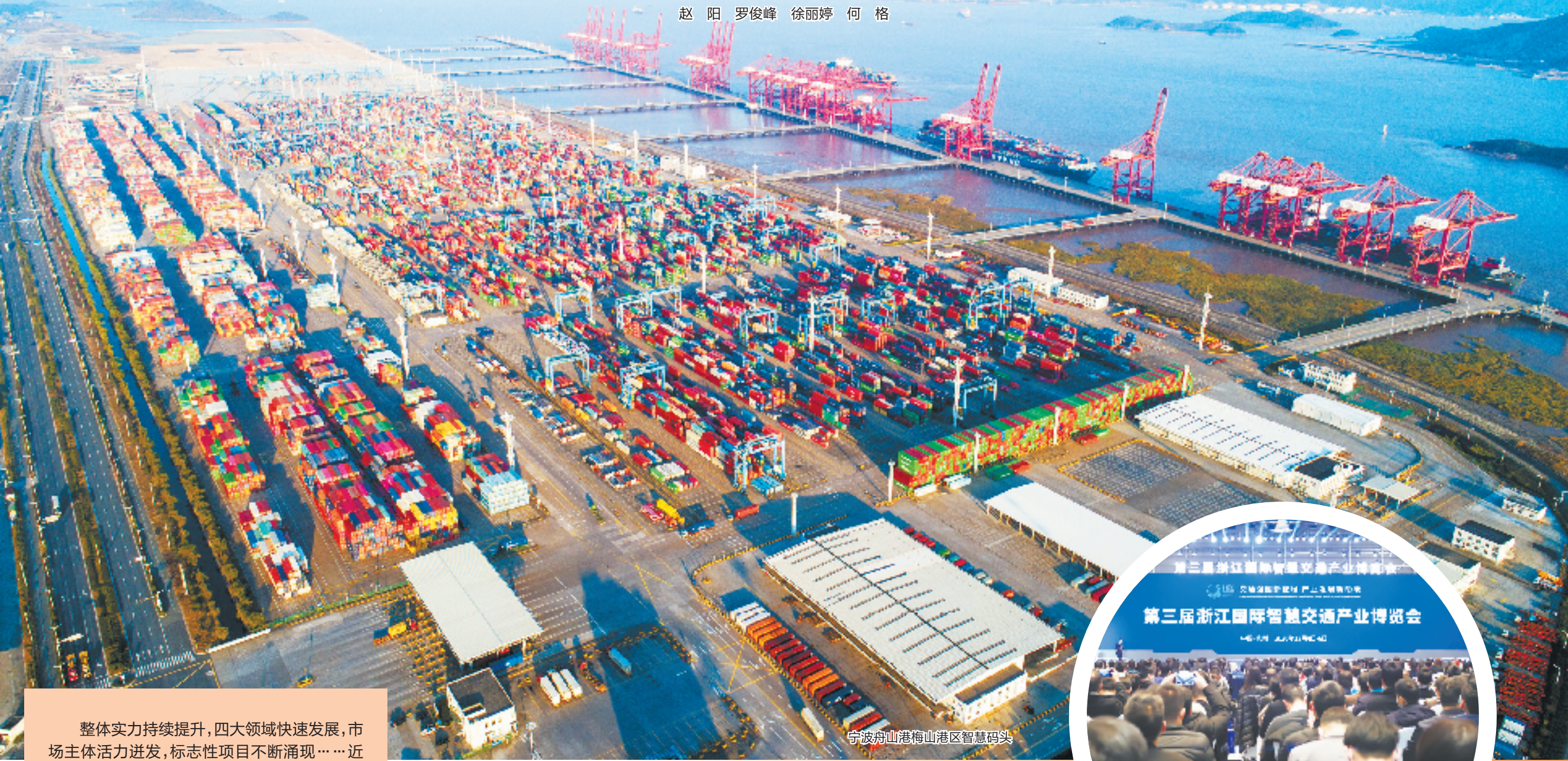
宁波舟山港梅山港区智慧码头