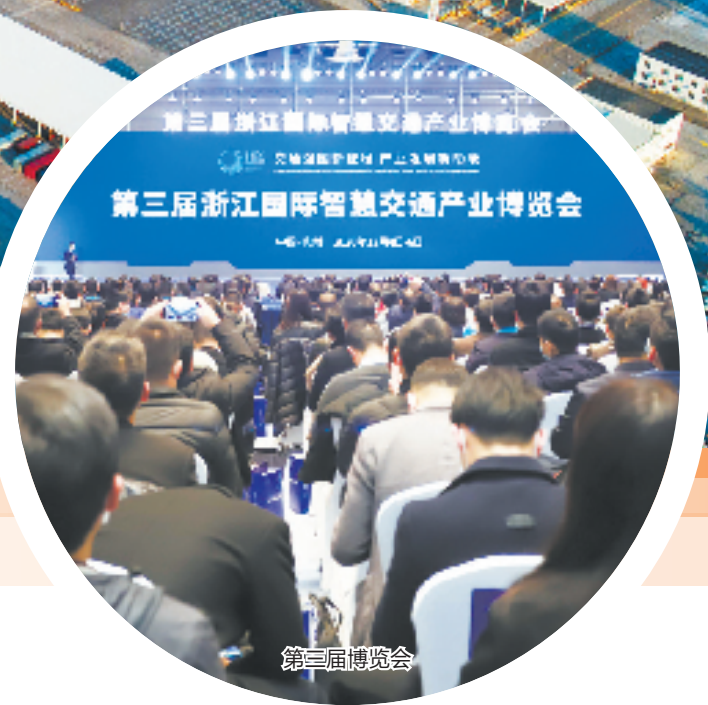
第三届浙江国际智慧交通产业博览会