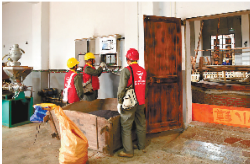
芳村供电所工作人员为榨油企业做检查并消除用电安全隐患

里对油茶产业扶持力度大,油茶种植也多,我们榨油厂的生意越来越好了,这几天天天忙着榨油,厂里的机器和我们一样,每天只能休息五六个小时,排队等着榨油的客户还很多。”