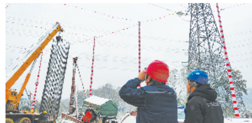
国网绍兴供电公司开展直流融冰工作

针对输电运维、检修、带电作业、电缆运检四大类输电全业务,建成各专核班组,扩大核心覆盖面,实现全品类检修能力覆盖。