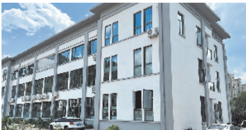
青田县腊口自然资源所 陈昭昭 摄

如今,丽水市各地自然资源所陆续规范窗口管理,公开办事指南,实行一次性告知,推行容缺审批、承诺审批等举措;设立意见箱、举报电话,