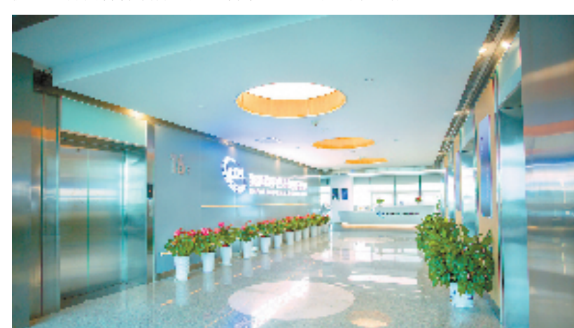
东南数字经济研究院

接下来，东南数字经济研究院将紧密结合衢州产业发展需求，为打造四省边际人才科创桥头堡提供强大支撑，成为以高端人才和科技创新赋能数字化改革、引领高质量发展的生动实践。