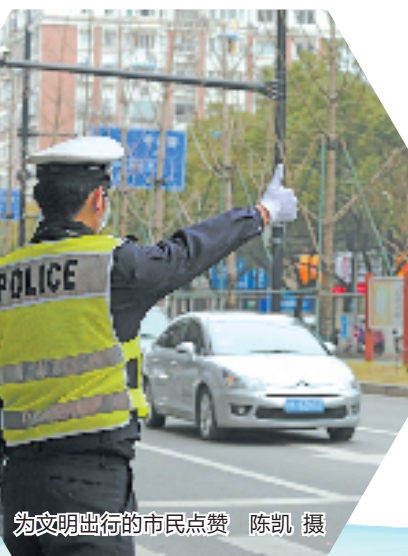
为文明出行的市民点赞

“当时他身着邋遢，一手拖着一个大行李袋，行走在机动车道内，十分危险。”前不久，莲都区交警巡逻至联城隧道时，发现一名50多岁的男子打算徒步去距离100多公里的武义投奔亲戚，在征得男子同