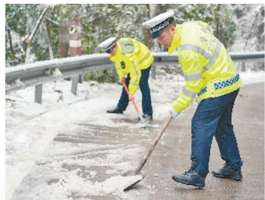
交警除雪保畅通

新征程上，丽水交警支队坚持以新时代“三能”铁军“挺进师”的奋进姿态和使命担当，充分发挥法治丽水、平安丽水建设主力军作用，努力在服务保障革命老区探索共同富裕道路上走在前列、成为示范。