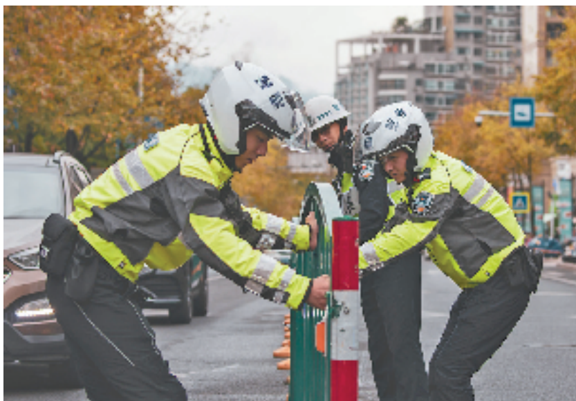
铁骑及时排除隐患

2021年以来，交警支队积极推动丽水市政府出台农村地区道路交通安全综合治理三年行动方案，以数字化改革为引领，围绕“人、车、路、管理力量、救治能力、守法意识”6个方面，实施“制度建设、道路提升、车辆监管、强化执法、道路救援、安全防范”六大组合拳，进一步健全和完善农村地区道路交通安全综合治理体系，奋力打赢农村交通安全治理“翻身仗”，努力实现“减量控大”总体目标。一直以来，丽水交警支队深化“三