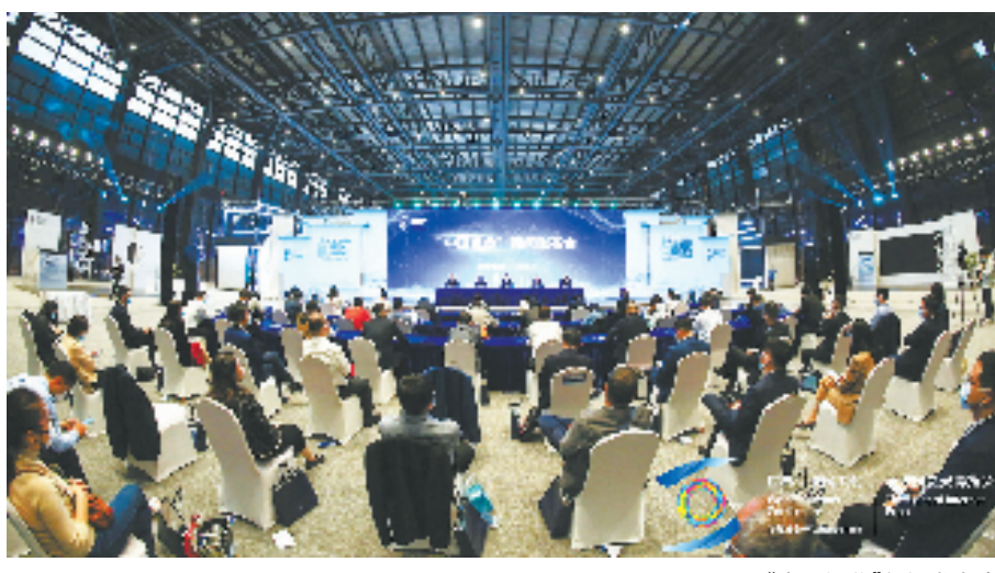
“中国视谷”新闻发布会

同时,聚焦生态圈建设,杭州市级层面密集出台智能物联、集成电路、软件和信息技术服务业、生物医药等产业政策,并为企业量身定制土地、资金、人才等方面的要素保障支持举措。