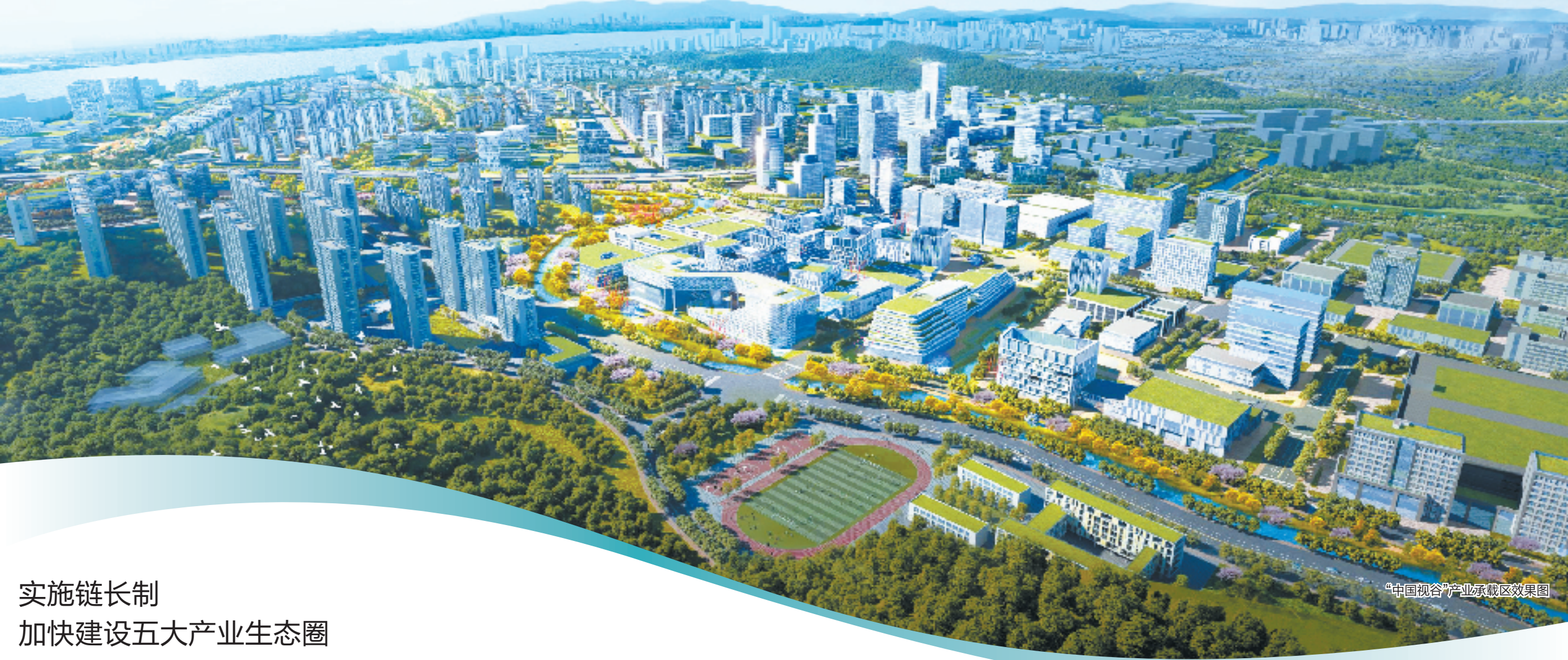
“中国视谷”产业承载区效果图

产业链供应链韧性提升与稳定国际论坛成功举办,发布“产业链供应链韧性提升与稳定国际合作倡议(杭州倡议)”;入选全国首批产业链供应链生态体系建设试点,“杭州市精准发力保障物流畅通促进产业链供应链稳定”典型做法获国务院第九次大督查通报表扬;在推进产业数字化等工作方面成效明显,获国务院督查激励。