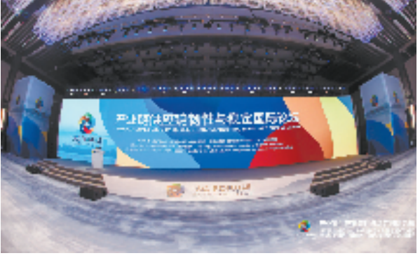
9月19日,产业链供应链韧性提升与稳定国际论坛在杭州开幕