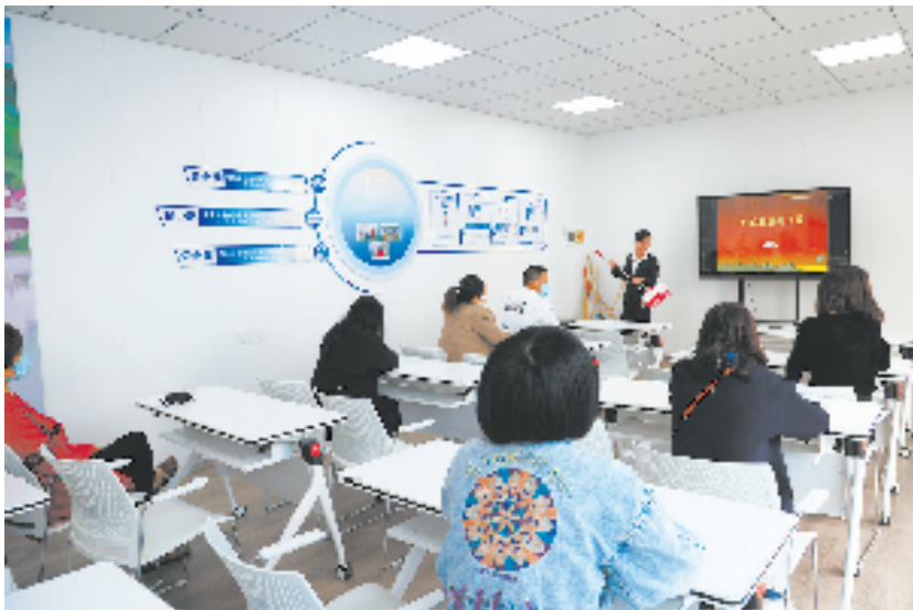
下涯乡村工坊组织开展岗前培训

“仅在下涯镇施家埠村辖区,就有34家规模以上企业,一方面企业有巨大的用工需求,另一方面,经过走访、摸排,下涯的村庄同样存在许多闲置劳动力,且收入不稳定。”下涯镇相关负责人介绍,为破解企业与农户的困难,今年以来,下涯镇凝聚村集体、企业代表、新乡贤、人大代表、政协委员等多方力量,有效统筹土地、房产、山林、劳动力等各类资源,大力建设乡村工坊,发展以“企+农”为主体的统购统销的多赢互利模式。同时,下涯镇还通过“小微权力一点通”平台,搜集一