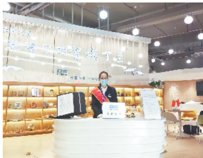
丁兰街道邻里中心医保办理窗口

医保视频办个人事项是杭州医保服务体制的创新,上城区丁兰街道纪工委也对此项工作流程及各项服务办理情况进行保障跟进,真正把医保窗口搬到群众家门口。打破医保经办地域限制,更好地满足群众零距离办理医保业务的需求,切实打通服务群众“最后一公里”,这种零接触的面对面办理方式,让医保服务更有温度。