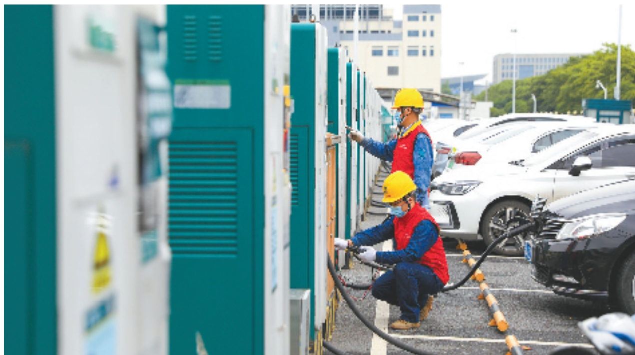
国网杭州市萧山区供电公司员工对萧山国际机场4号停车场充电站开展全面“体检”。

余杭区径山镇一民宿,因铺设了充电桩,无形中带来额外的客源,让该民宿在旅游旺季一房难求。