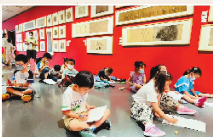
2022年6月24日,“盛世修典——‘中国历代绘画大系’嘉兴特展”在浙江嘉兴市文化艺术中心开幕。不少学生来现场对着中国古代名画进行临摹练习。

到2022年年底,历时17年的“中国历代绘画大系”文化工程即将结项。该工程由浙江大学、浙江省文物局编纂出版《先秦汉唐画全集》《宋画全集》《明画全集》《清画全集》60卷226册,是迄今为止同类出版物中精品佳作收录最全、出版规模最大的中国古代绘画图像文献。