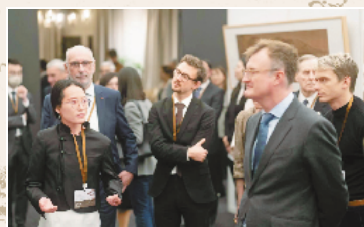
2022年12月5日,“‘中国历代绘画大系’之宋画欧盟特展”在比利时布鲁塞尔开幕。图为导览员在为大家讲解宋画。