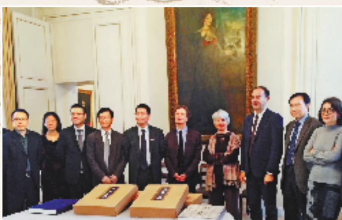
2015年10月14日,浙江大学将《宋画全集》和《元画全集》各一套捐赠给法国国家图书馆。