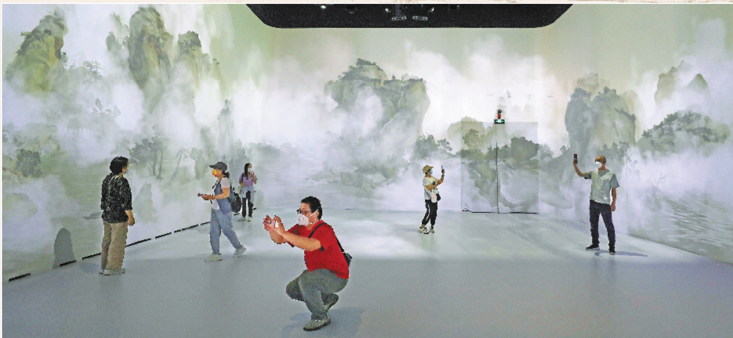
2022年9月29日,“盛世修典——‘中国历代绘画大系’成果展”在北京中国国家博物馆开幕。展览以图像、文字、视频等多元展示手法,呈现中国古代绘画的辉煌成就。