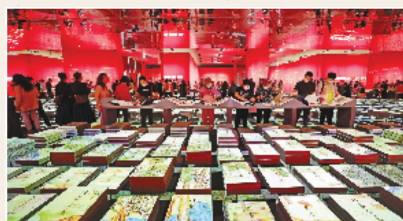
2022年9月29日,“盛世修典——‘中国历代绘画大系’成果展”在北京中国国家博物馆开幕,展陈面积总计约6000平方米,是国家博物馆近年来展陈面积最大的展览之一。