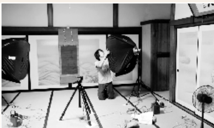
2007年8月,专业摄影人员在日本寺院拍摄中国古画。