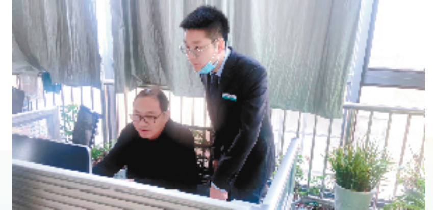
农行丽水分行客户经理上门指导企业申请线上贷款