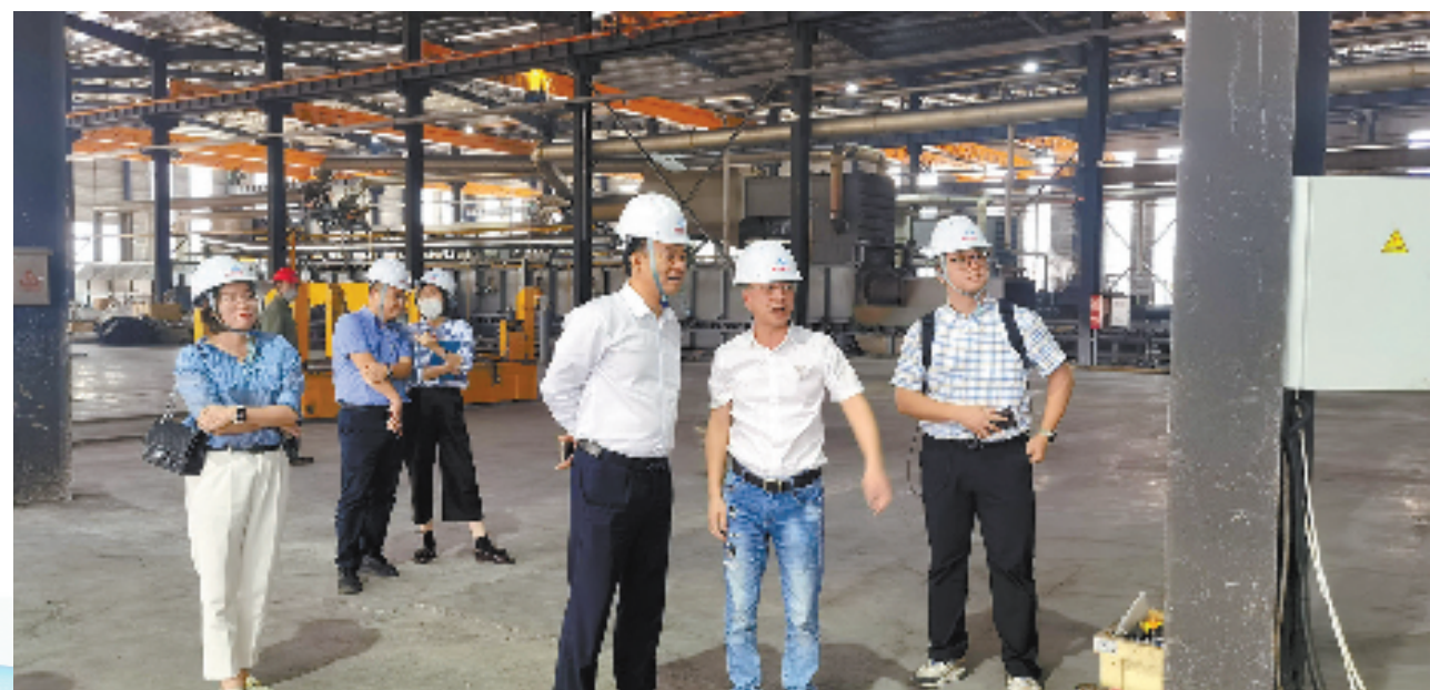
招商银行温州分行行长室在重点企业实地了解金融需求

在供应链中,小微企业占据了绝大部分,犹如毛细血管一般。针对此类企业,招商银行温州分行积极依托供应链核心企业信用输出,运用无感支付、承兑一体的票据产品等为供应链小微企业提供快速服务。11月,该行联手省内唯一一家国网以外拥有法定供电资质的地方电网企业永强供电,共同秉承服务实体经济的初心,率先在本地落地了“电费票”模式,利用票据产品普适性强、操作便捷、安全高效的金融科技优势,为缴费小微企业降低缴费融资成本,同时达到线上无感缴费体验。