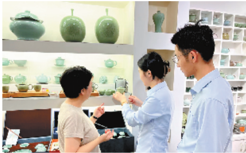
农行服务团队到龙泉青瓷工作室走访调查

轻企业,趁着松阳县加快打造不锈钢产业集群的东风,成立伊始就迎来快速发展期,销售额快速增长,2021年达到了3700万元。但今年原材料价格飙升,该公司营运成本急剧攀升,加之财务结算周期普遍较长,一时间面临资金周转的压力。