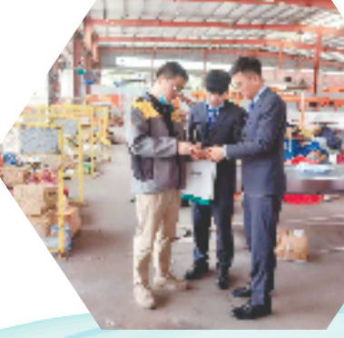
农行丽水分行为丽水市联合韵达快递有限公司快速解决融资难题