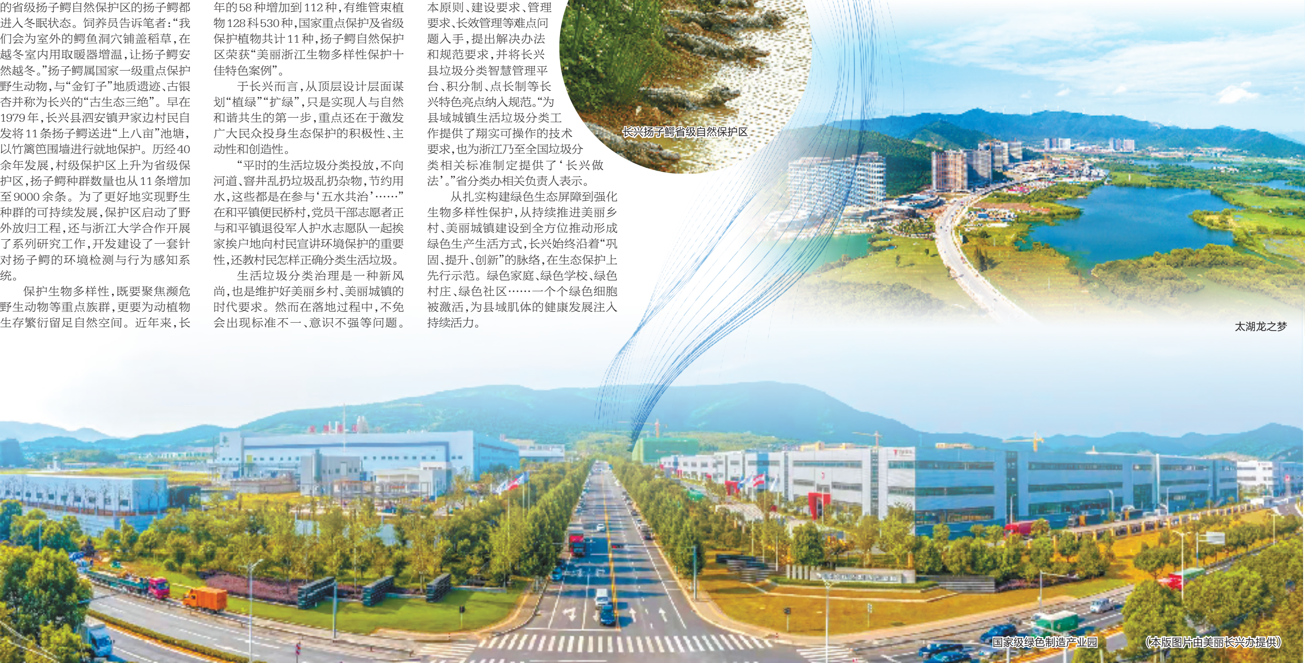
国家级绿色制造产业园