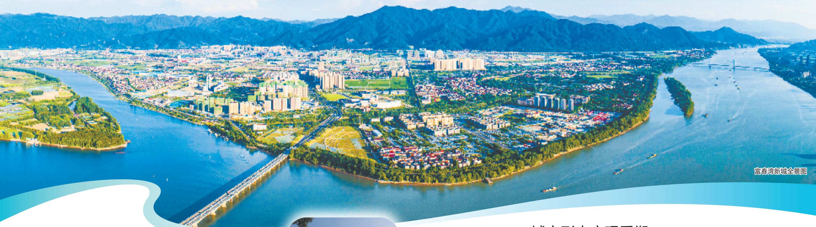
富春湾新城全景图

2022年11月17日,杭州高新区(滨江)与杭州市富阳区签署了合作深化协议,打造滨富特别合作2.0版,合作力度、层次、领域再提升,一个事关产业合作的新篇章随之开启。