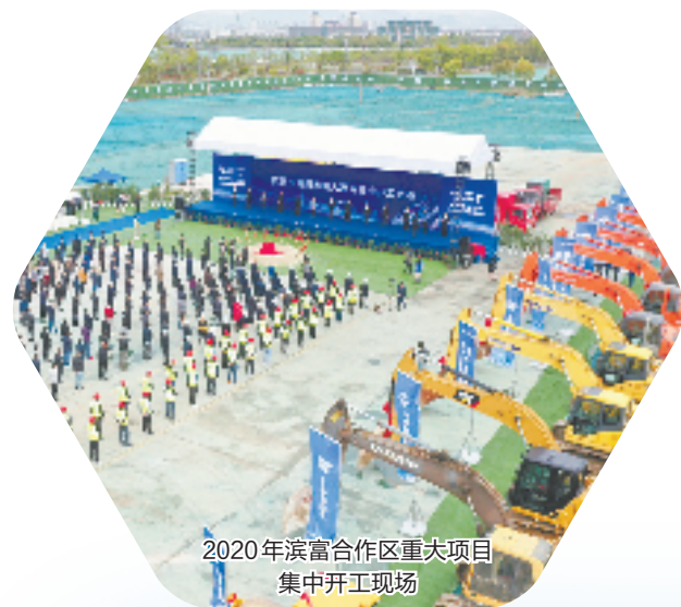
2020年滨富合作区重大项目集中开工现场

未来,特别合作区将重点依托大项目建设带动产业集群发展,积极培育和壮大产业链上下游,力争形成更高级别的产业集聚,同时聚力打造滨富特别合作2.0版,利用“特别资源”,依托“特别优势”,努力成为跨区域协同共富发展提供“特别经验”。