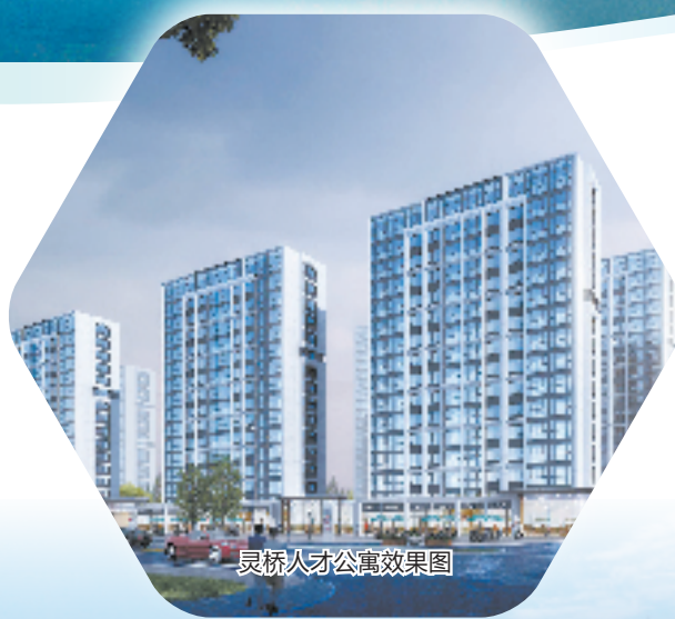
灵桥人才公寓效果图

在杭州富春湾新城实施造纸产业整体转型时,“富阳区聚力”“腾笼换鸟”,稳步推进新旧动能转换”还入选2021年度浙江省经信系统“最佳实践”,这里也是杭州市唯一入选“忠实践行‘八八战略’、奋力打造‘重要窗口’”重点建设省级工业项目所在地。