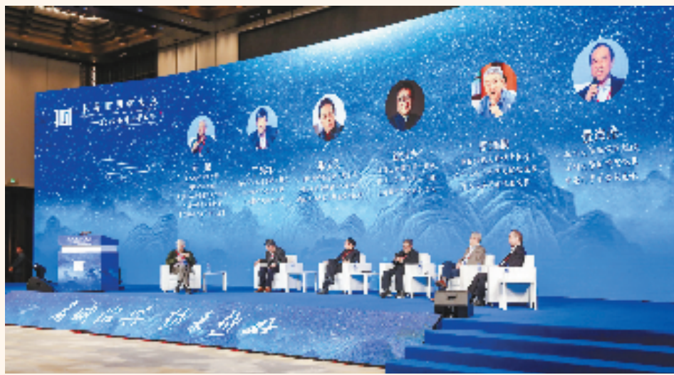
世界阳明学大会暨2022阳明心学大会现场