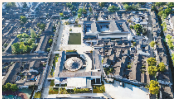
鸟瞰绍兴阳明故里