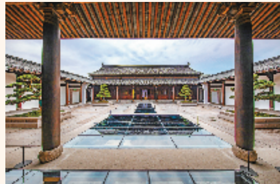
绍兴复建的王阳明伯府第内景

价值诉求。 “心即理”是实现共同富裕的理论基础。阳明先生认为传统或者道统必须建立在心的基础之上。“知行合一”“致良知”是共同富裕的实现方式,“明德”“亲民”是实现共同富裕的本原动力。 阳明心学对共同富裕有诸多启示,我们可以把他的思想精髓转化为现实中解决实际问题的方法遵循。在实现共同富裕的道路上,我们应当知行合一,建立健全相关体制机制,为真正实现共同富裕提供更多制度保障。