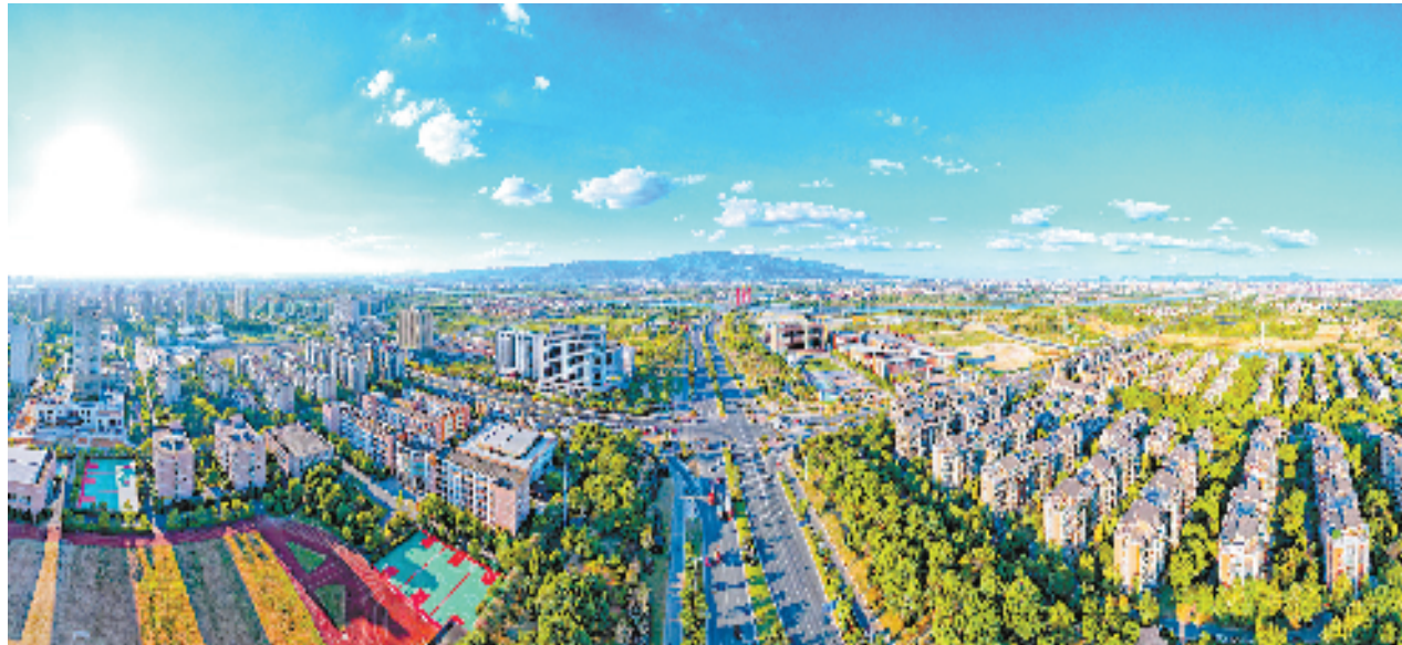
婺城新城区鸟瞰图

“值得一提的是，今年引进的正向增材总部及数字制造项目，总投资50.83亿元，实现投资50亿元以上项目当年签约、当年落地和当年入统零的突破。”婺城区投资促进中心负责人吴向阳介绍，今年项目引进势头迅猛，无论是数量和质量，还是单体投资规模都创下历史新高，各项指标较往年同期均实现大幅增长，实现了“项目质量大提升、项目落地大提速”。