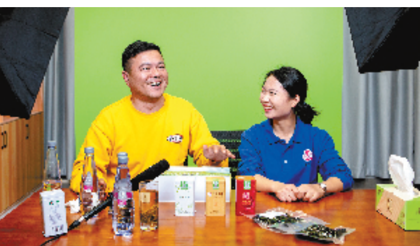
民盟同心网络直播平台推介桃花岛当地农特产品