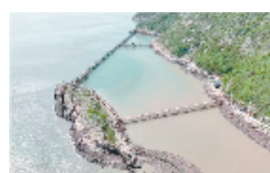
舟山市首个浅海大型高端生态网箱养殖工程技术产业化应用示范基地

“我们还注重异地商会力量，建立健全联系交流机制，不定期邀请异地商会回家乡考察交流，并到上海、杭州等多地开展座谈会，强化沟通交流，促进资源回归。”普陀区委统战部相关负责人介绍，同时引导商会和民营企业积极践行“普商精神”，投身资助助学、助残助困等社会公益事业，奉献商会爱心，展示时代风貌。通过制定海岛孤困群众需求清单，呼吁、引导商会和民营企业认领“情暖夕阳”困难老年人救助、“快乐假期”困境儿童陪伴、平太荣助学专项基金、东润爱心助行慈善基金等一批携老、扶幼、兴教、助困帮扶项目19个，累计捐赠善款900余万元。