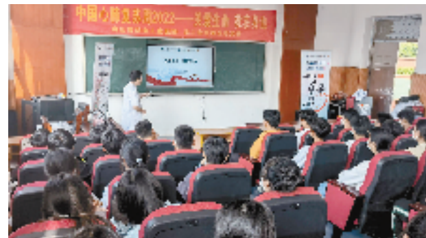
农工党定海区总支部赴育才学校开展心肺复苏科普培训

定海区委统战部相关负责人表示，今后将持续发挥“同心服务”基地作用，统筹各民主党派力量，拓宽助力乡村振兴工作领域，合力推动“同心服务”高效运转，助力乡村振兴，为定海奋力争创高质量发展建设共同富裕示范区港城标杆贡献统战力量。