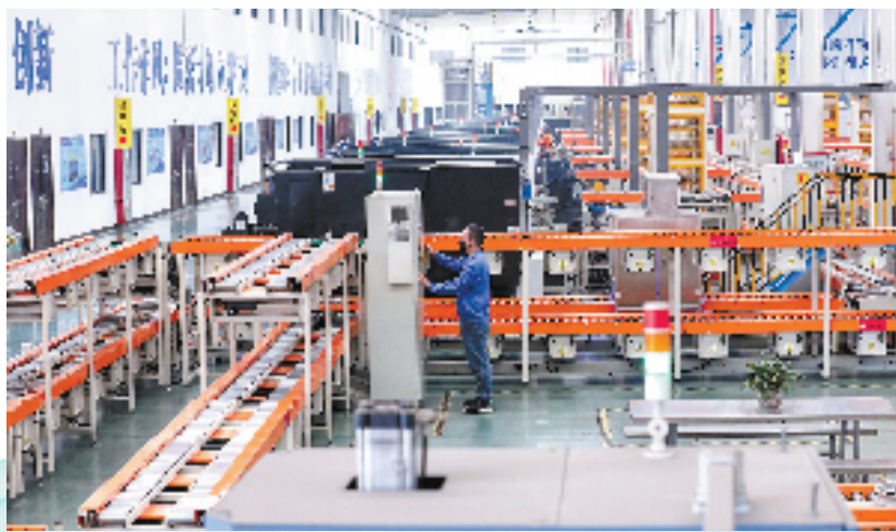
今飞智造摩轮数字化生产车间

“人人都是招商主体、时时都是招商时段、事事都是招商形象。”在“一把手”招商带动下，婺城构建起全区“一盘棋”招商引资工作格局，坚决下好招大引强“先手棋”，全面掀起招商引资新热潮。截至今年11月底，已签约3亿元以上产业项目21个，协议总投资237.77亿元，其中10亿元以上制造业项目8个，50亿元以上1个；总落地项目9个，其中10亿元以上落地项目5个；开工项目4个，入统4个。