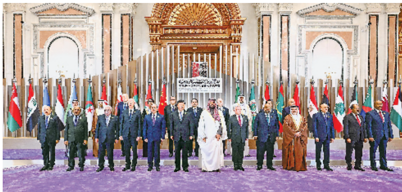
当地时间12月9日下午，首届中国-阿拉伯国家峰会在沙特首都利雅得阿卜杜勒阿齐兹国王国际会议中心举行。国家主席习近平和沙特王储兼首相穆罕默德、埃及总统塞西、约旦国王阿卜杜拉二世、巴林国王哈马德、科威特王储米沙勒、突尼斯总统赛义德、吉布提总统盖莱、巴勒斯坦总统阿巴斯、卡塔尔埃米尔塔米姆、科摩罗总统阿扎利、毛里塔尼亚总统加兹瓦尼、伊拉克总理苏达尼、摩洛哥首相阿赫努什、阿尔及利亚总理阿卜杜拉赫曼、黎巴嫩总理米卡提等21个阿盟国家领导人以及阿拉伯国家联盟秘书长盖特等国际组织负责人出席峰会。