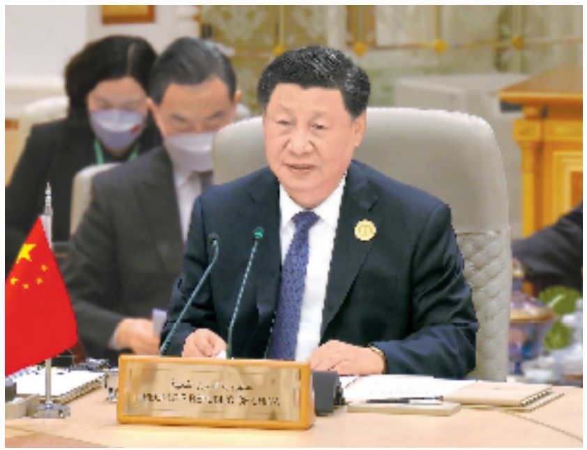
当地时间12月9日下午，首届中国-海湾阿拉伯国家合作委员会峰会在利雅得阿卜杜勒阿齐兹国王国际会议中心举行。国家主席习近平出席峰会并发表题为《继往开来，携手奋进 共同开创中海关系美好未来》的主旨讲话。

构建能源立体合作新格局 推动金融投资合作新进展 拓展创新科技合作新领域 实现航天太空合作新突破 打造语言文化合作新亮点