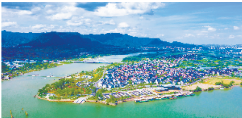
富阳区东洲街道富春江村小沙岛头 富阳区东洲街道供图

坚持“绿水青山就是金山银山”理念，加快绿色发展转型步伐。近年来，杭州市富阳区东洲街道坚持“生态与绿色并重”“乡味与野趣共享”“数字与产业同频”发展思路，大力打造现代版富春山居图东洲画卷。在努力实现高质量发展的过程中，东洲街道仍面临区域共治方面的难题。