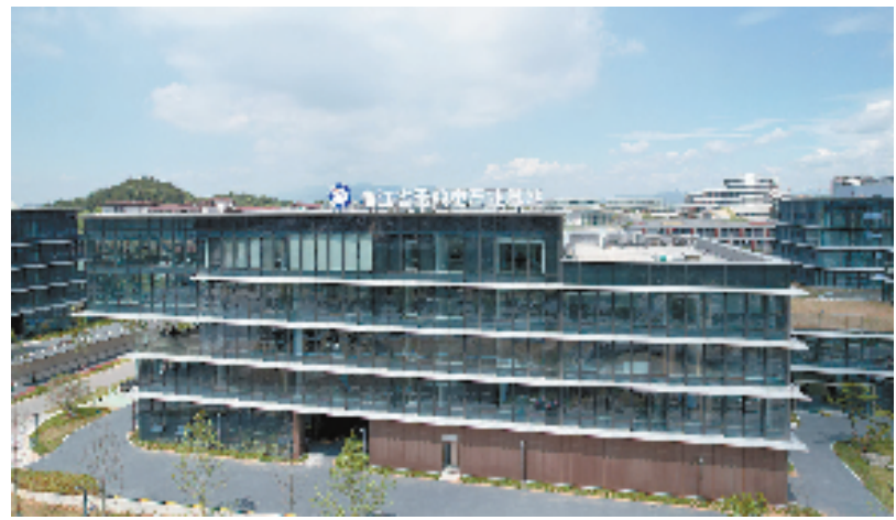
浙江省无线电产业基地

当前，智慧新城已摘取省级高新技术产业园区、省无线电产业基地、省现代服务业创新发展区3块省级金字招牌。下一步，智慧新城将继续紧扣衢州市主导产业，加快产业链创新链深度融合，推进重大科技创新平台建设，为全面打造四省边际人才科创“桥头堡”提供有力的人才支撑和人才保障。