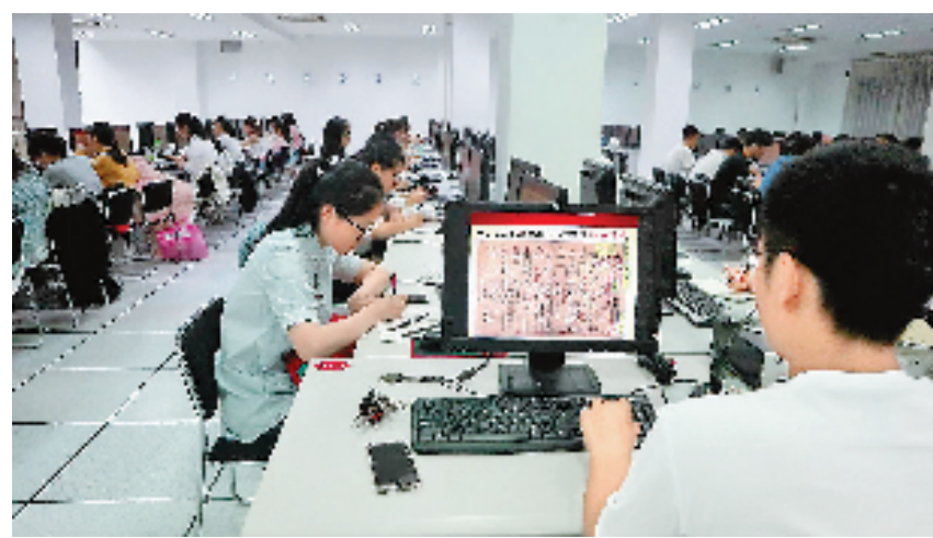
浙江大学兰溪鱼鳞图册整理与文本录入现场。