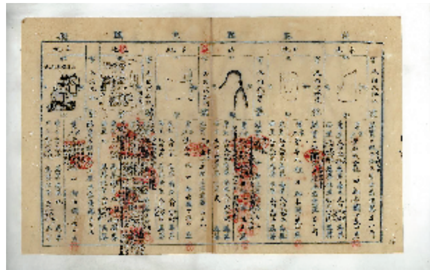
同治兰溪四都一图鱼鳞图册。