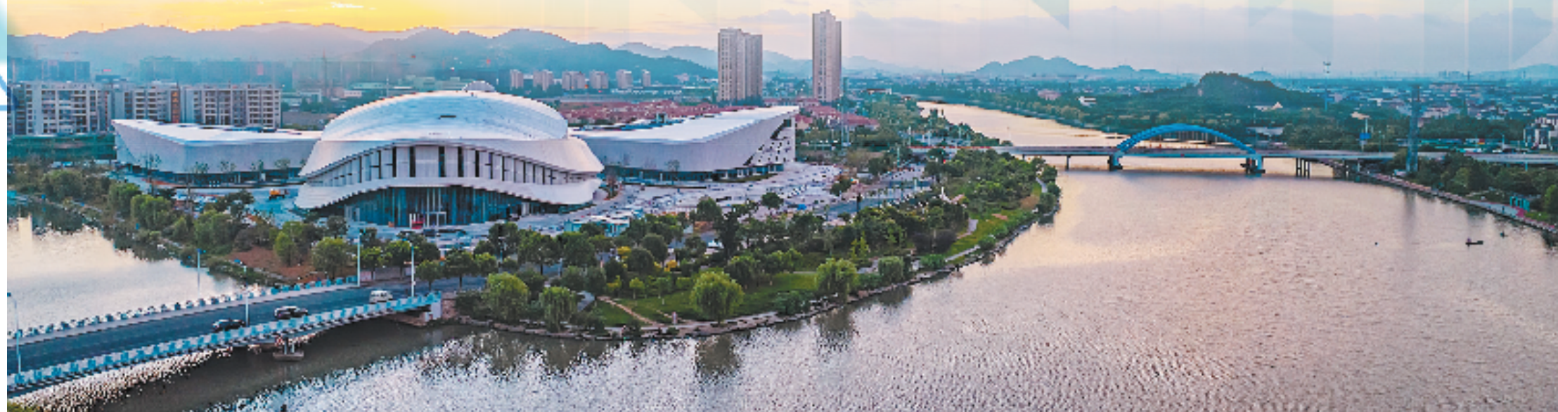
余姚公共文化中心