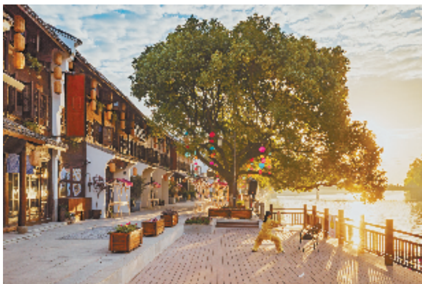
阳明古镇

业31家、省级专精特新企业51家，今年新入选宁波市专精特新中小企业68家，数量居宁波第一。