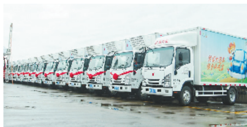
山区26县“供富大篷车”集中发车仪式在衢州举行

仪式上还发布了“供富大篷车”标识标志系统及《供富大篷车服务管理团体标准》。省供销社、省商务厅、衢州市人民政府、各市供销社、山区26县供销社及山海协作结对县供销社等相关单位领导出席本次活动。