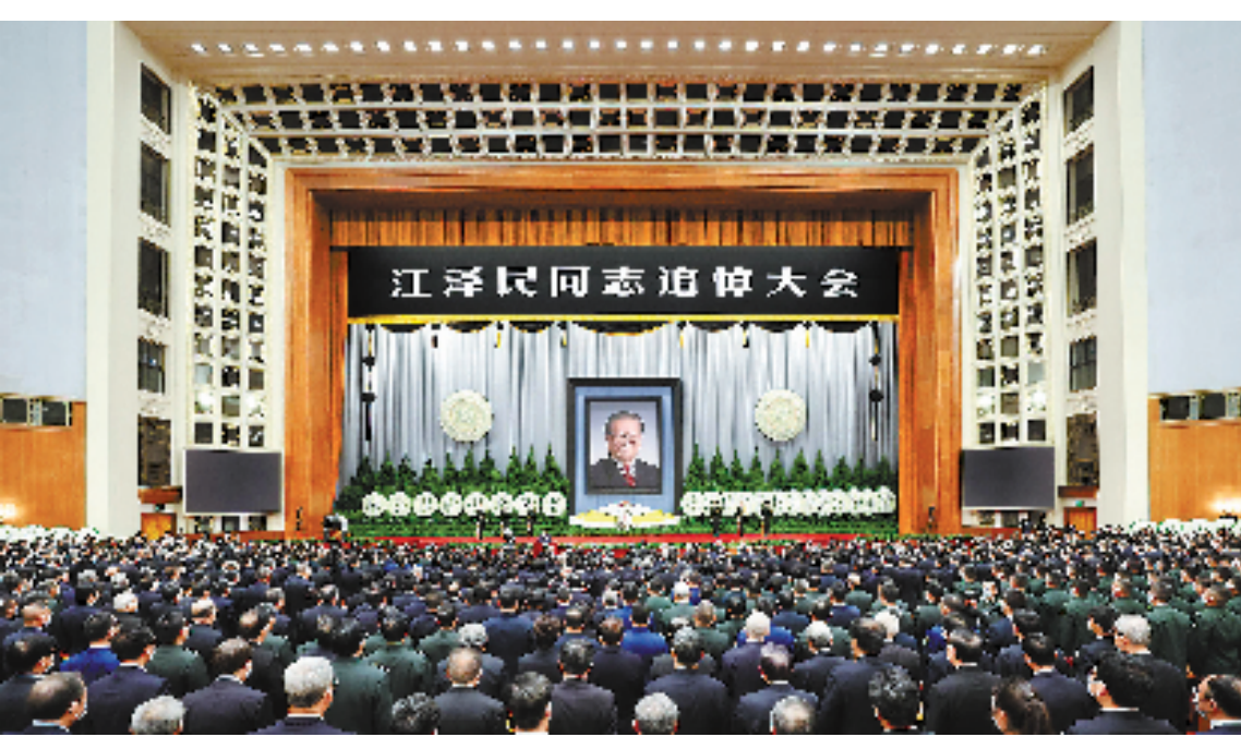
12月6日，中共中央、全国人大常委会、国务院、全国政协、中央军委在北京人民大会堂隆重举行江泽民同志追悼大会。新华社记者 丁海涛 摄