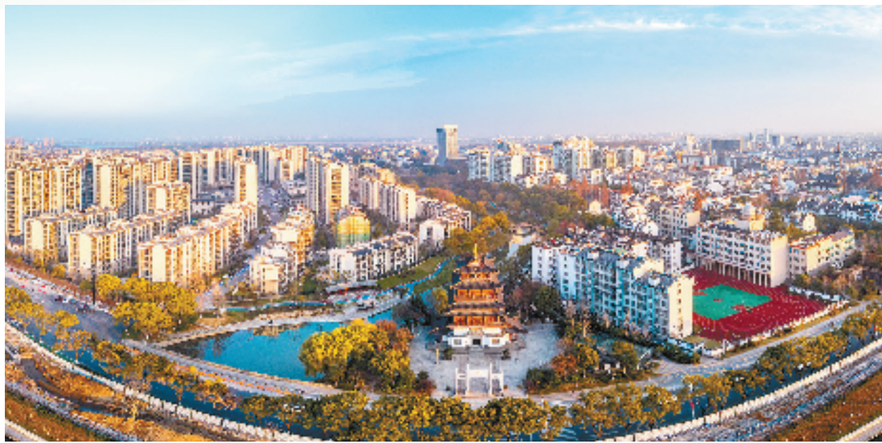
斗潭未来社区

为此，柯城打造“邻礼通”数字民情档案，动态归集人、房、户、车、场所五大类全量信息，涵盖居民的身份信息、工作信息、政治面貌和房屋的业主、居住人员、物业费缴纳情况等40余项信