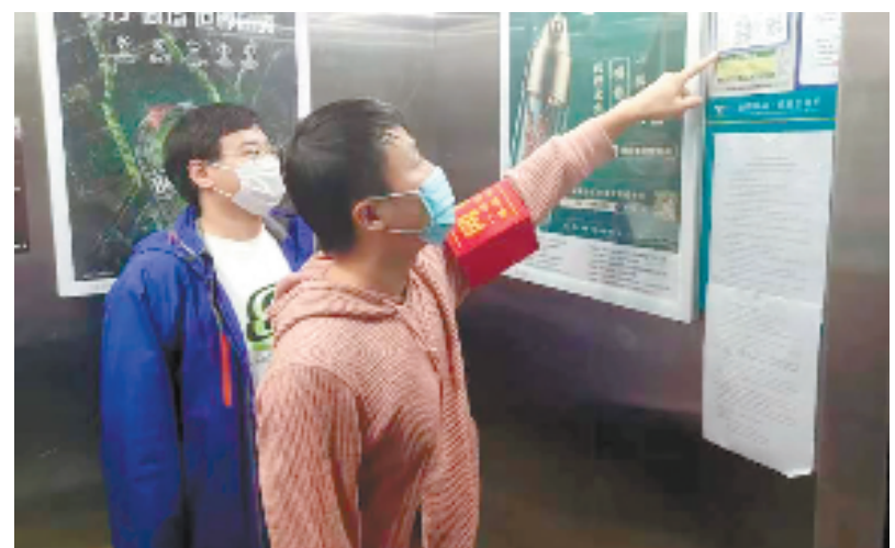
小区专员进小区关注群众需求

“我们将把微治理的小切口融入共同富裕的大场景，继续办好‘治理未梢’的小事要事，共建共同富裕现代化基本单元。”拱墅区委组织部有关负责人表示。