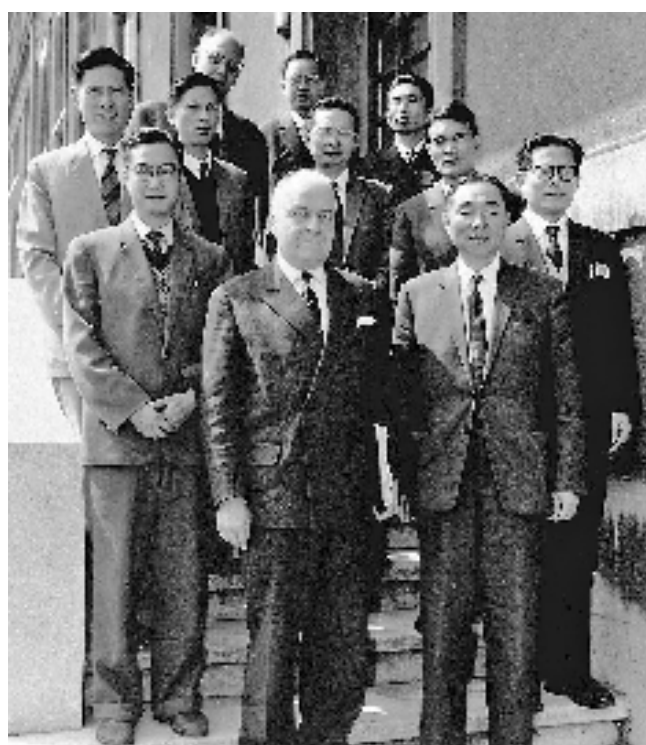
上图:1964年6月,江泽民同志(二排右一)在法国艾克斯莱班出席国际电工委员会会议期间与会代表合影。