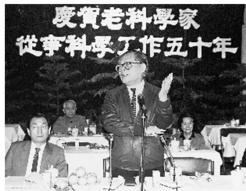
上图:1988年10月,江泽民同志在上海庆贺老科学家从事科学工作五十年座谈会上讲话。