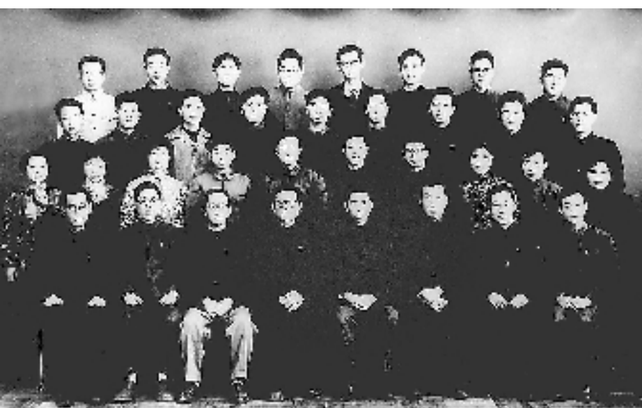
上图:1963年3月,江泽民同志(前排右五)在上海同小型三相异步电机全国统一系列设计领导小组成员合影。