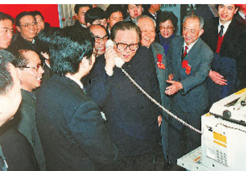
上图:1984年5月,江泽民同志在北京展览馆举行的全国电子新产品展览会上,试用国际长途电话向远方的工作人员问候。