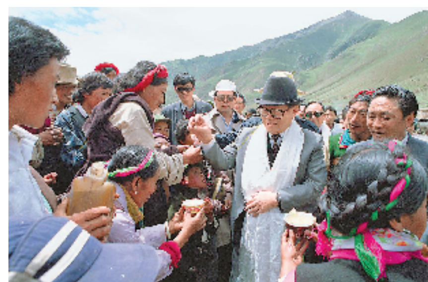
上图:1990年7月25日,江泽民同志与藏族群众共庆望果节。