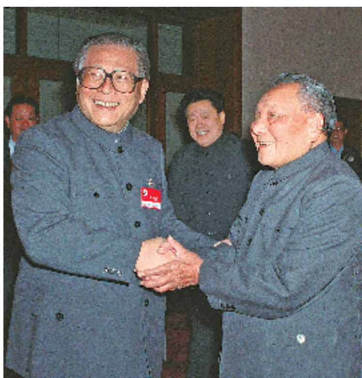
右图:1989年11月6日至9日,中国共产党第十三届中央委员会第五次全体会议在北京召开。这是邓小平同志和江泽民同志亲切握手。