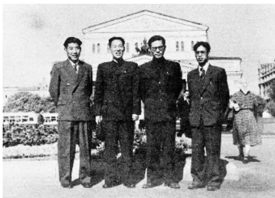
上图:1955年至1956年,江泽民同志(右二)曾在莫斯科大林汽车制造厂实习。这是江泽民等在莫斯科合影。