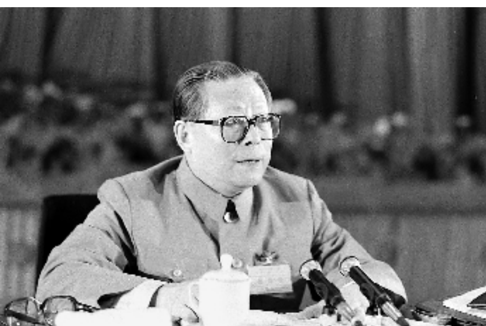
上图:1989年6月23日至24日,中国共产党第十三届中央委员会第四次全体会议在北京召开。这是江泽民同志在会上讲话。