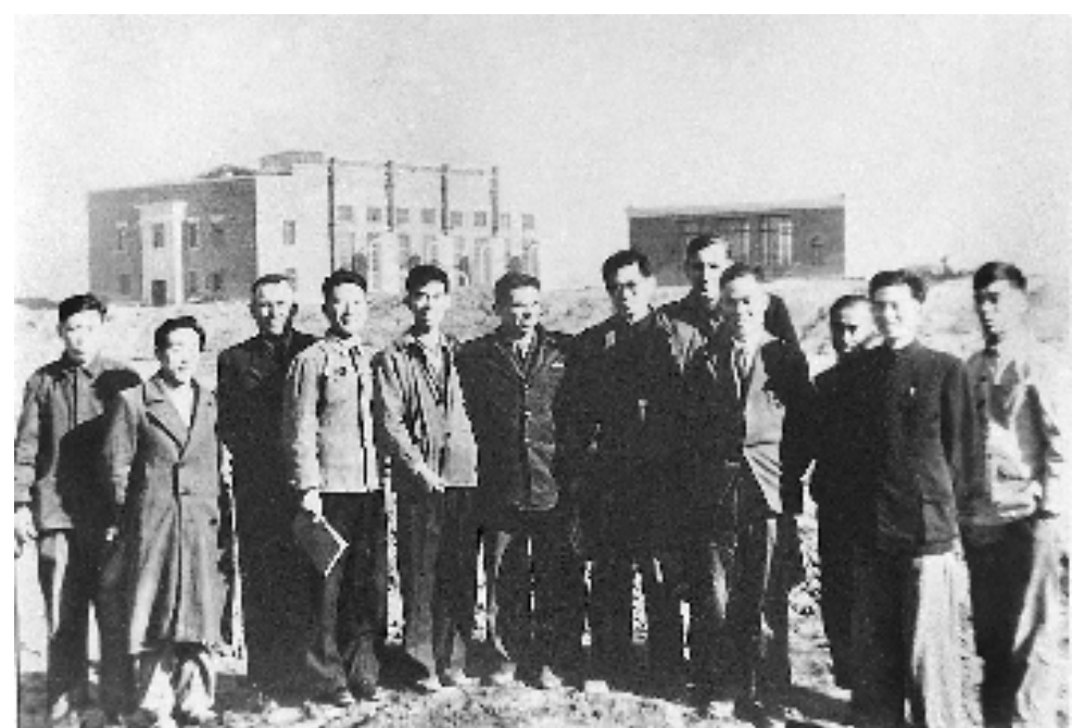
上图:1956年,江泽民同志(左七)在长春第一汽车制造厂同援建一汽的苏联专家等合影。