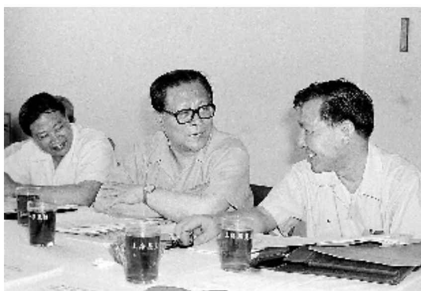
上图:1985年,江泽民同志在上海市八届人大四次会议上。