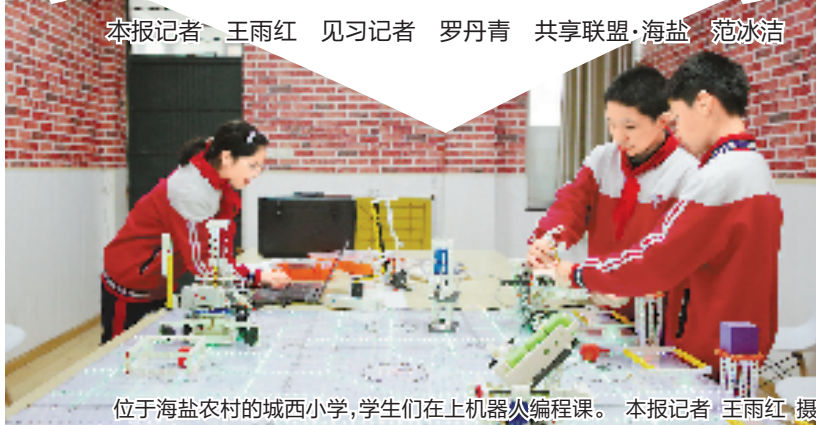
位于海盐农村的城西小学,学生们在上机器人编程课。