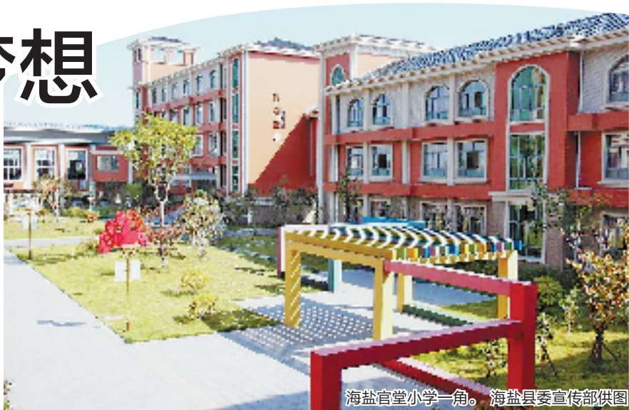
海盐官堂小学一角。

这些年,海盐的义务教育发生了不少变化:越来越多的好学校出现在家门口,城乡教育差距在同步发展中日益缩小,农村孩子的综合素质日益全面提升……不久前,海盐获评全国义务教育优质均衡发展县。