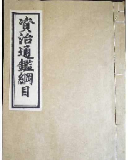
新入藏的明内府刻《资治通鉴纲目》。

“学术是立馆之本,项目是发展之基。我们今后将为杭州国家版本馆的发展规划、科研活动、展览策划和实施、学术建设和交流等方面,提供专业的意见、帮助和服务,努力将杭州国家版本馆打造成为版本收藏的重地、版本研究的高地、版本展示的阵地,文化交流的福地。”范景中说。