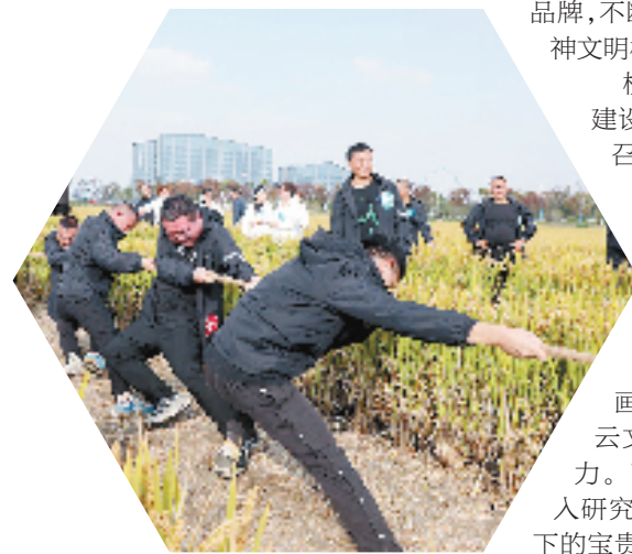
嘉善县大云镇举行农耕趣味运动会

校地合作，助力文化强镇建设。前不久，大云镇发起号召，联合浙江大学、嘉兴学院、嘉善县社科联、平湖市钟埭街道、南湖区大桥镇等，共同成立“姚绶研究联盟”，未来将通过校地协作共研共建模式，对姚绶人文精神及书画成就开展多维研究，为大云文化强镇建设注入更多活力。下一步，大云镇将继续深入研究姚绶等本地先贤、乡贤留下的宝贵遗产，进一步提高书画艺术的普及率，为嘉善县推进精神文明建设和文化大县建设作出应有的贡献。