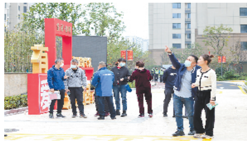
黎明社区回迁户看房

中村改造，开始整村拆迁。历时5年，黎明社区的晨世黎明嘉苑二区、三区安置房完成建设，朝着现代社区建设“强社惠民”目标越来越近。从远处望去，安置房高楼相邻而立，大气的外观、阔绰的楼间距吸人眼球；走近细