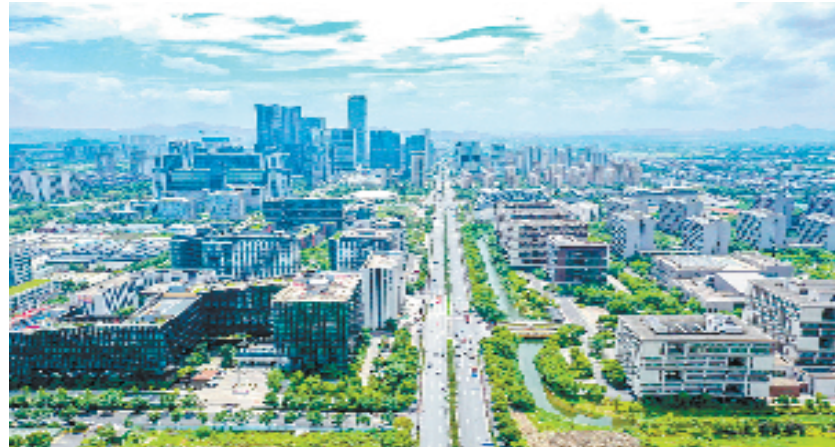
活力仓前