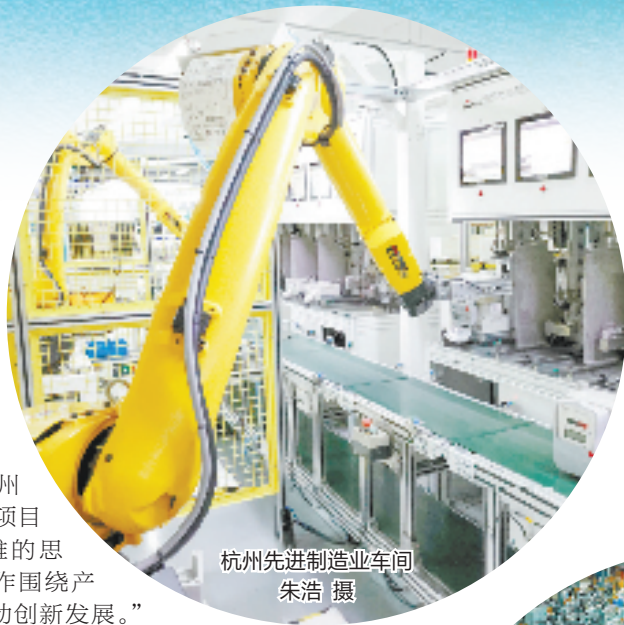
杭州先进制造业车间

杭州投资促进局相关负责人介绍,今年杭州五大产业生态圈确立以后,杭州投资促进局立即成立了五大招商专班,把具有核心竞争力的优势产业作为招商引资的主攻方向,让真正好的项目为杭州高质量发展提供高质量支撑。