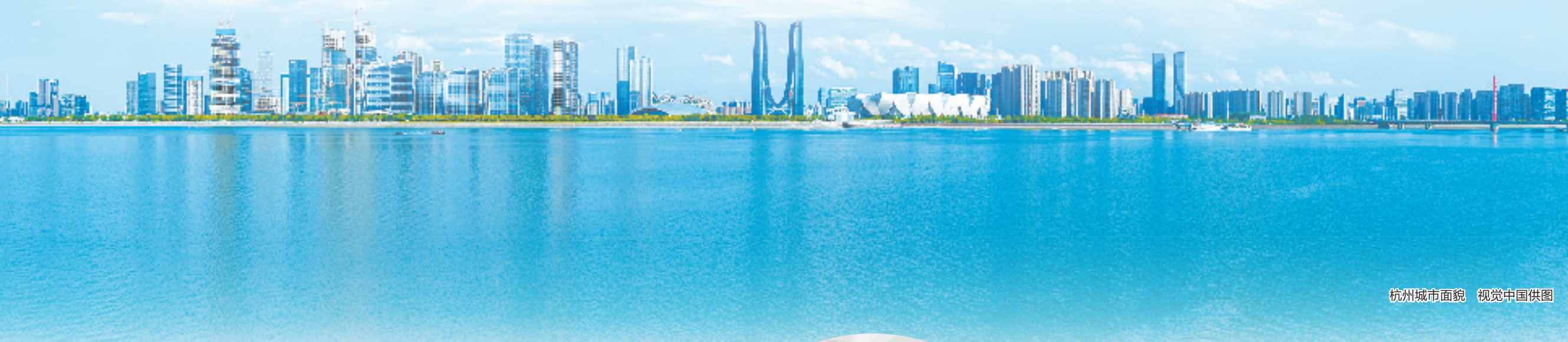
杭州城市面貌

高质量发展是全面建设社会主义现代化国家的首要任务。杭州市投资促进局负责人说:“招商引资是一项关乎现代化产业体系的牵引性工作、支撑性工作,我们切实担负起招大引强攻坚责任,聚焦‘万亿产业、千亿企业、百亿项目’,为杭州加快建设世界一流的社会主义现代化国际大都市贡献力量。”