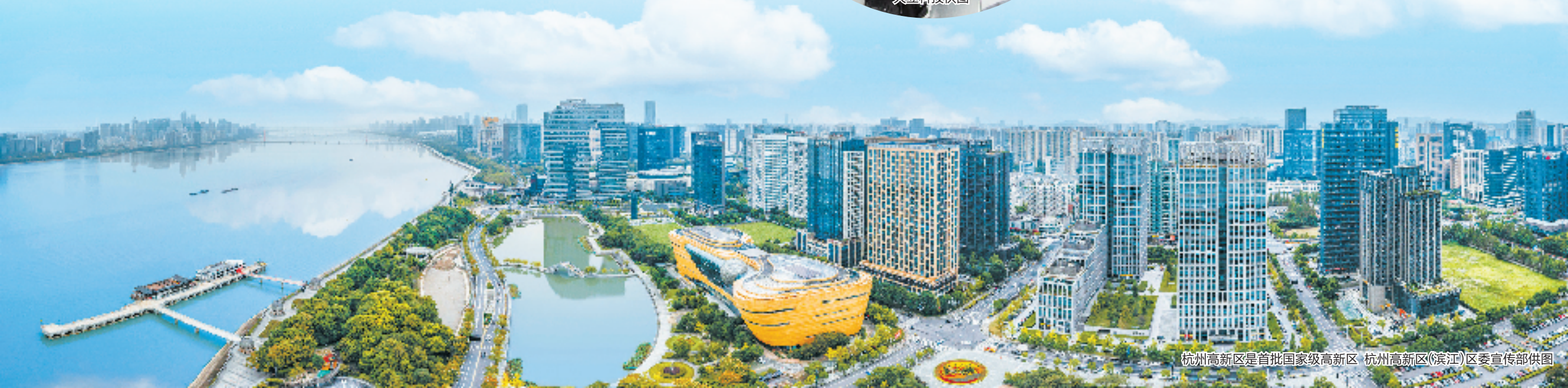
杭州高新区是首批国家级高新区