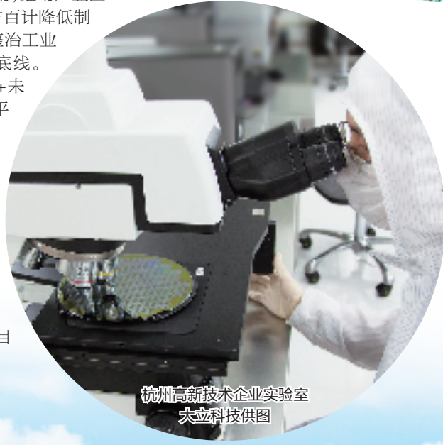
杭州高新技术企业实验室

策划生成项目,让招商引资有了更多源头活水。围绕体系化谋划,明年杭州计划策划生成总投资10亿元以上的重大产业项目100个以上。