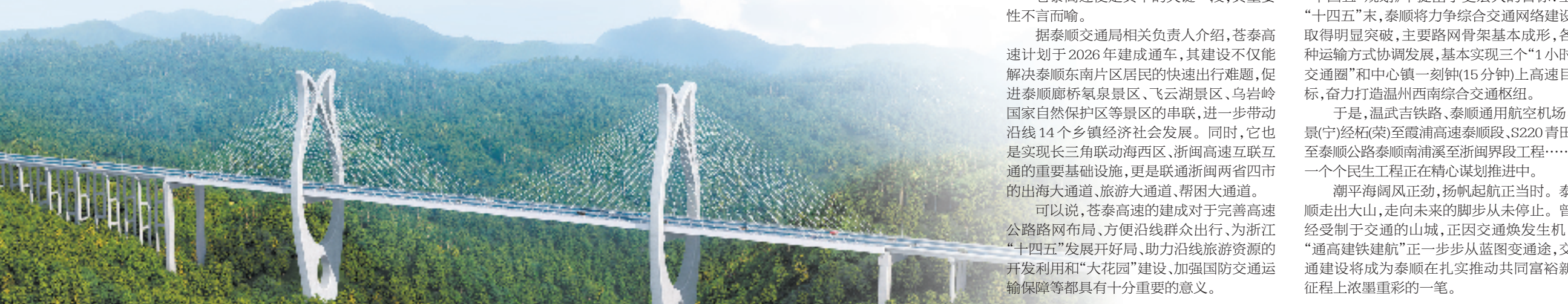
苍泰高速泰顺段东溪斜拉桥(效果图)