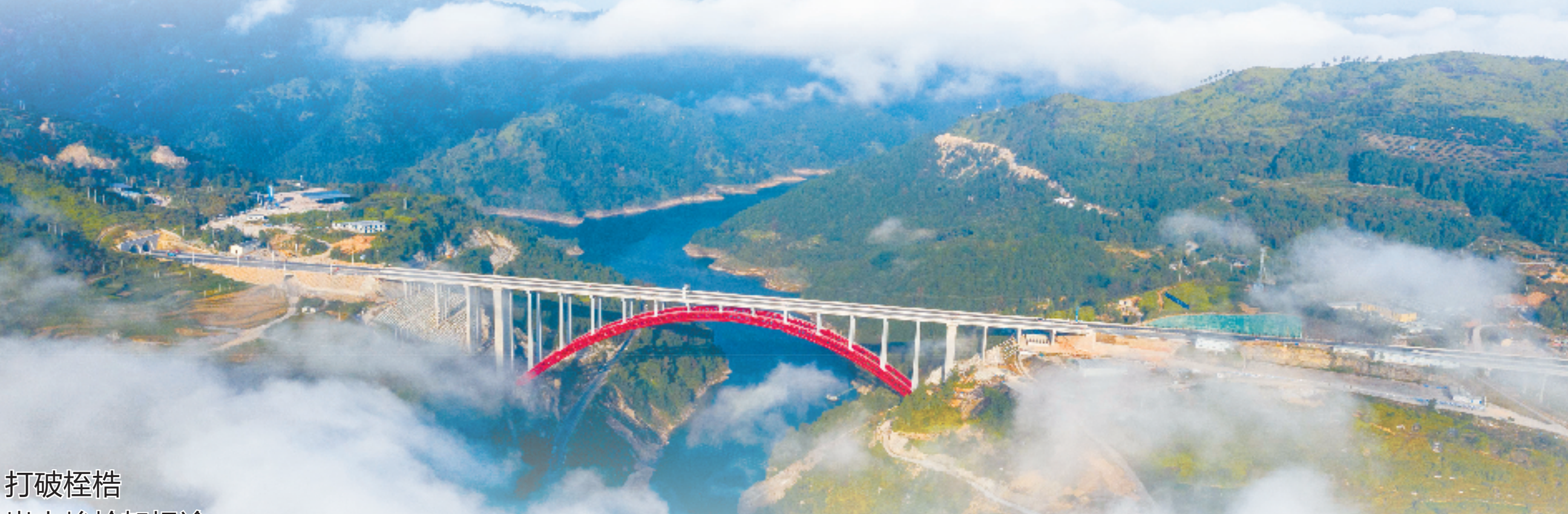
文泰高速南浦溪大桥

潮平海阔风正劲，扬帆起航正当时。泰顺走出大山，走向未来的脚步从未停止。曾经受制于交通的山城，正因交通焕发新机：“通高铁建通航”正一步步从蓝图变通途，交通建设将成为泰顺在扎实推动共同富裕新征程上浓墨重彩的一笔。