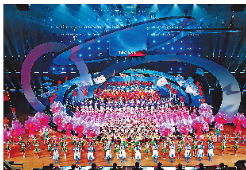
省运会闭幕式现场。

这是浙江省运史上规模最大、项目最丰富、参赛人数最多的一届。此次省运会增设了短道速滑、冰球、花样滑冰等3个冬季冰上项目,街舞、小轮车、山地自行车等7个奥运项目、10个非奥项目及电动冲浪板表演项目,以期备战奥运、亚运,全运打下坚实的人才基础,为浙江竞技体育发展注入新的活力。