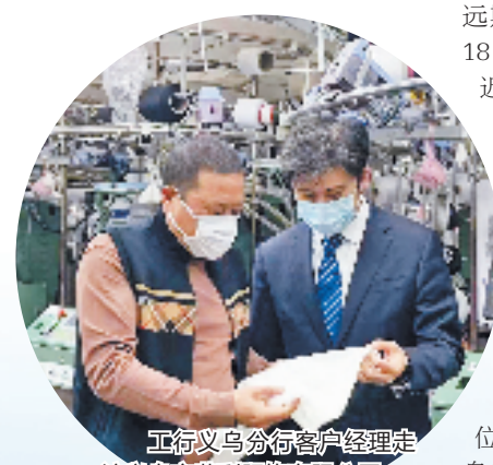
工行业务分行客户经理走访义乌市荣利服饰有限公司

未来，工行业务分行将进一步强化责任担当，融入发展大局，引导外贸客户树立汇率风险中性理念，积极推动政策落地落实，为外向型经济提供多层次、全方位的金融服务，擦亮义乌外贸名片。