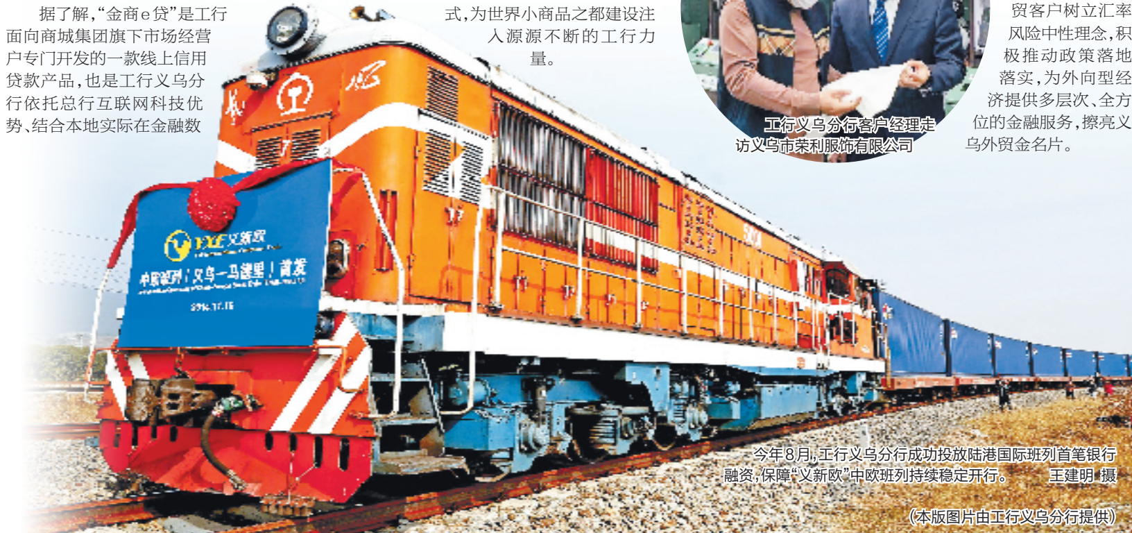
今年8月，工行业务分行成功投放陆港国际班列首笔银行融资，保障“义新欧”中欧班列持续稳定开行。