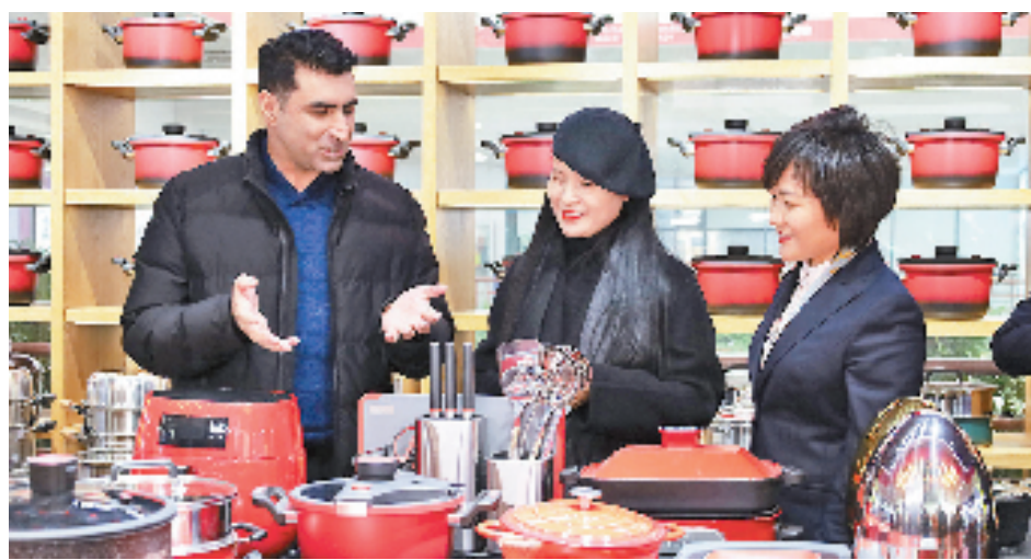
工行走访在义乌国际商贸城经商的外国客商，深入了解金融需求。