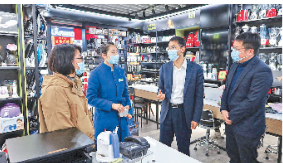
工行到义乌国际商贸城调研，助力解决市场经营户的融资结算难题。

与此同时，该行加大信贷纾困力度，成立一把手挂帅的助稳经济工作领导小组，出台“助稳经济工作措施12条”。主动减费让利，普惠贷款利率连续6年下调。对受疫情影响较大的住宿餐饮、批发零售、文化旅游等行业，在贷款规模支持、费用减免和利率优惠等方面加大倾斜力度。对出现暂时还款困难的企业，一户一策做好融资接续安排，截至10月末，已为58家企业、1233位个人办理续贷、展期、延期还本付息等业务，涉及纾困金额39.16亿元，为实体经济撑起一片天。