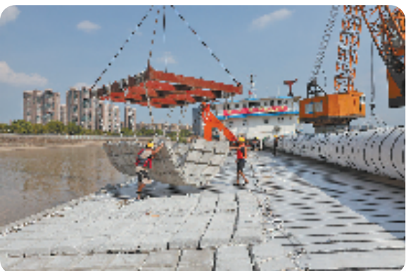
钱塘江西江塘闻堰段海塘提标加固工程施工现场