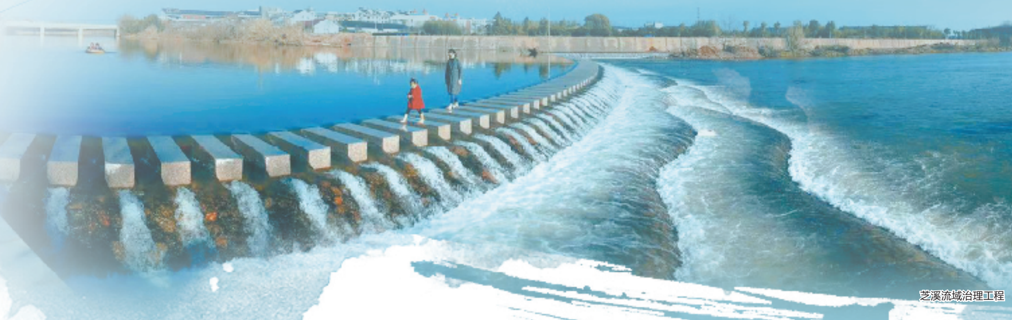
芝溪流域治理工程