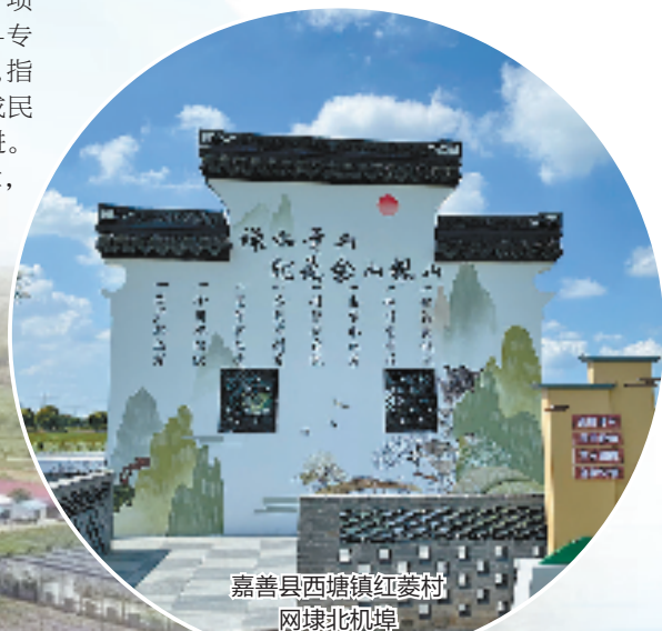
嘉善县西塘镇红菱村网垵北机埠

青山巍巍,绿水汤汤,那散落其间的水库山塘,正守护着诗画浙江的一方平安,让乡村“诗和远方”的成色更足。今年以来,水库除险加固病险和山塘整治项目实施后,已累计恢复有效库容1.1亿立方米,防洪、灌溉、供水功能进一步恢复,直接保护110万人,更有效改善了全省各地的生态环境质量,为美丽乡村增添了更多绿意。