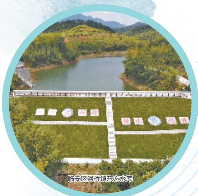
临安河桥镇东方水库