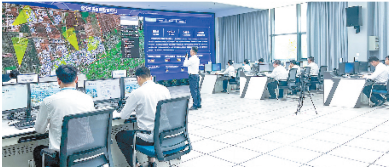
智慧园区综合监管平台

单元”,关系到基层治理的效能与温度。近年来,上虞区以数字化为手段,实现网格治理质效双提升。