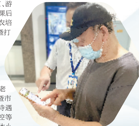
社保工作人员协助退休老人使用“退休小管家”

凡是过往,皆为序章。接下来,诸暨将坚定不移推动改革向广度和深度进军,着力破解深层次体制机制障碍,持续塑造新动能新优势,为坚持发展新时代“枫桥经验”、高水平谱写“两个先行”诸暨篇章蓄势赋能。