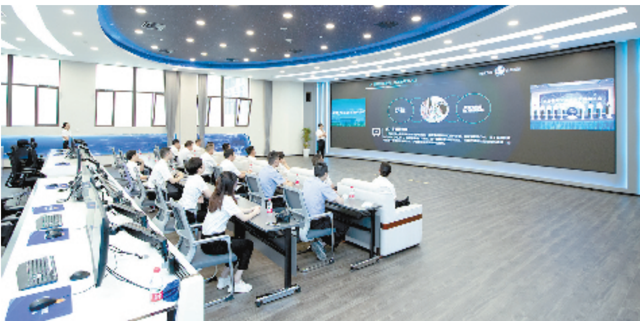
“执行全流程数字协同改革”应用大屏

珍珠、同山烧、香榧、袜子……提到诸暨,脑海中会自动蹦出这些名词。近年来,诸暨抢抓数字化改革新机遇,致力将数字经济与实体经济相融合,大力推动“直播+产业集群”模式