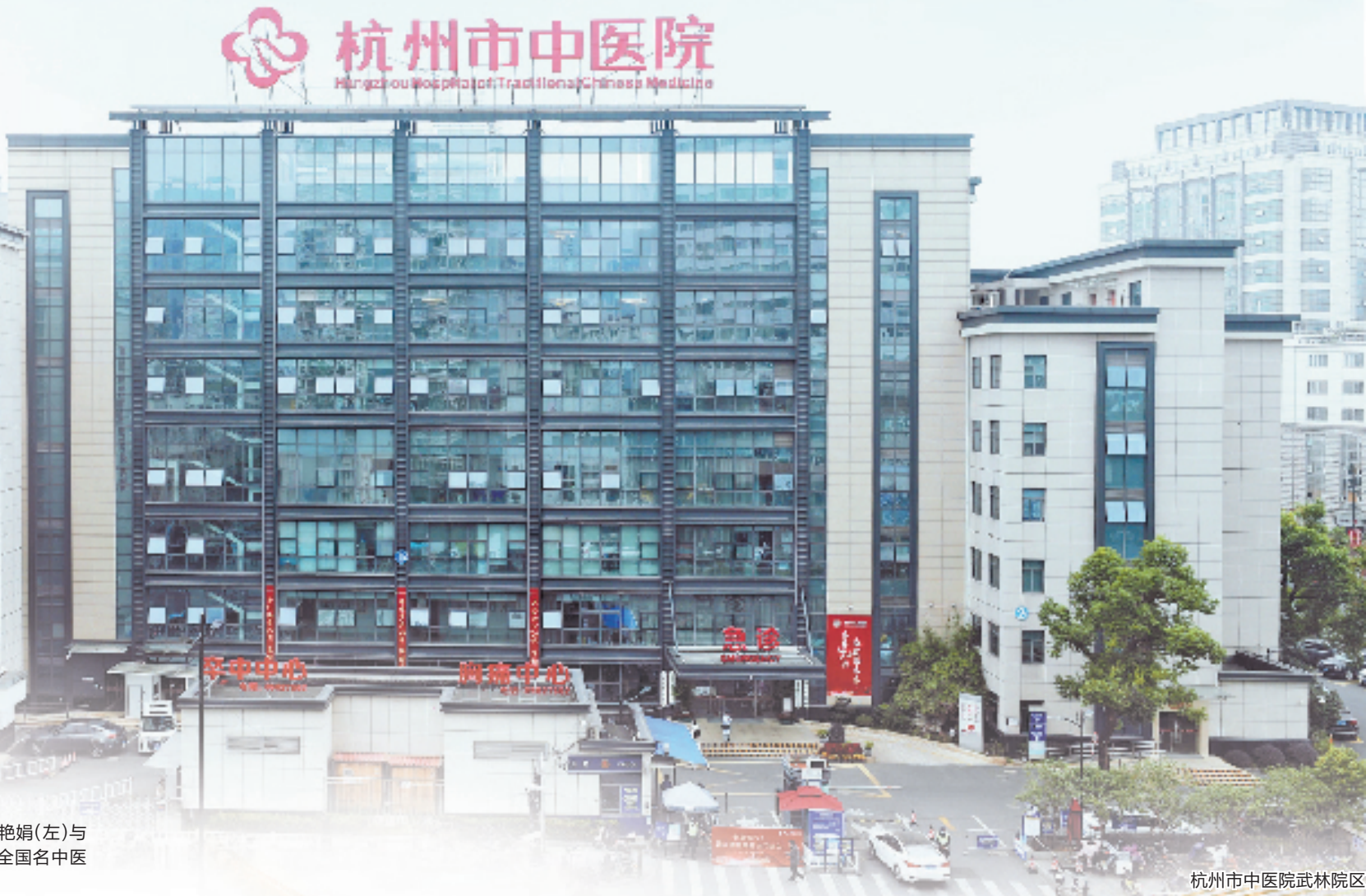
杭州市中医院武林院区