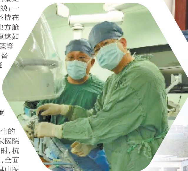
骨伤科专家正在施行UBE微创手术

大医精诚,止于至善,是医者毕生的追求;勇于担当、甘于奉献,是每一家医院应有的作为。在做好自身服务的同时,杭州市中医院不断优化医疗资源下沉,全面托管建德市中西医结合医院、淳安县中医院、临安区中医院;不断深化双向转诊服务,积极推进城市医疗联合体建设工作,联合西湖区、上城区等10家社区卫生服务中心组建“医疗联合体”;结合学科优势,定期对3家托管医院、12家协作医院的医生进行业务轮训,帮助基层医院建立导师带徒机制,开设中医馆。与宁波市中医院深度合作,积极探索杭甬双城市级中医院协作