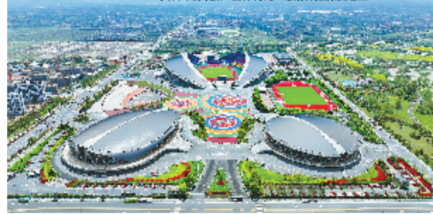
金华市体育中心鸟瞰。