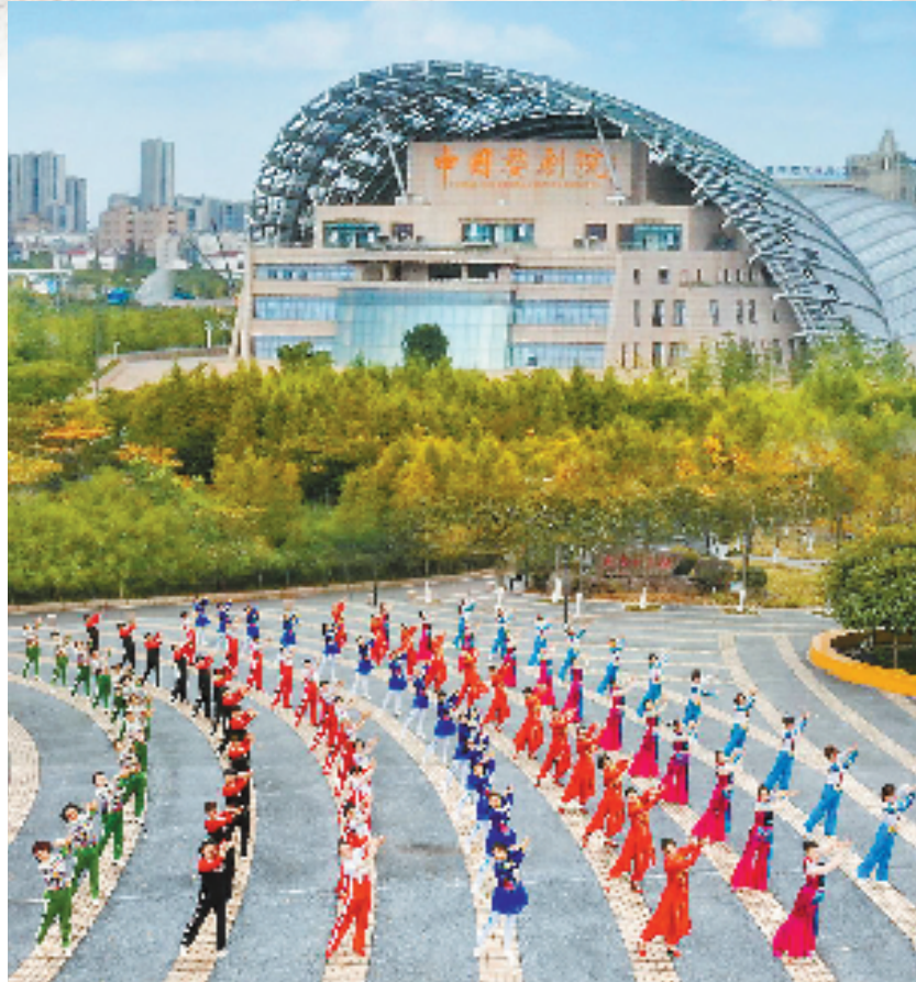
金华推动竞技体育与群众体育深度融合,举行“五个一百”群众体育活动1367场。图为群众排演健身操。

省运会疫情防控及医疗保障工作组相关负责人表示,7月中旬,省运会疫情防控组就邀请省卫健委疾控处、省疾控中心相关专家进行研讨,针对不同疫情态势采取相应的防控措施,包括延迟办赛、全闭环办赛、半闭环办赛、常态化办赛等。同时,结合各地办赛实际,制定了67个“一馆一策”疫情防控方案、62个“一赛一策”医疗保障方案等,以确保省运会安全、顺利举办。