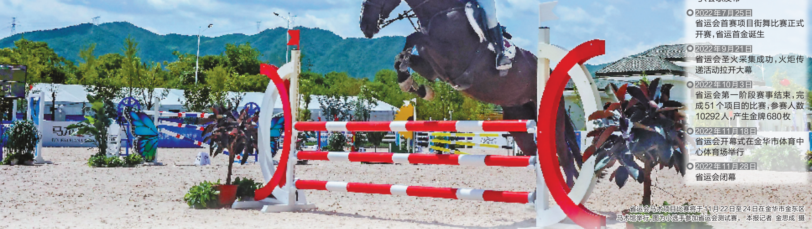
省运会马术项目比赛将于11月22日至24日在金华市金东区马术馆举行,图为小选手参加省运会测试赛。

本届省运会如何为杭州亚运会打好前站,又将给城市发展带来哪些新动能?在开幕式进入倒计时之际,记者走进金华,一探究竟。