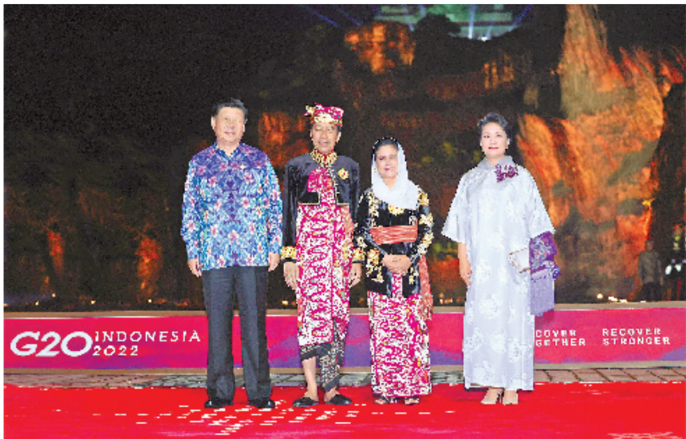
当地时间11月15日晚,国家主席习近平和夫人彭丽媛在印度尼西亚巴厘岛出席二十国集团领导人峰会欢迎晚宴。这是习近平主席夫妇在晚宴前同印度尼西亚总统佐科夫妇合影。