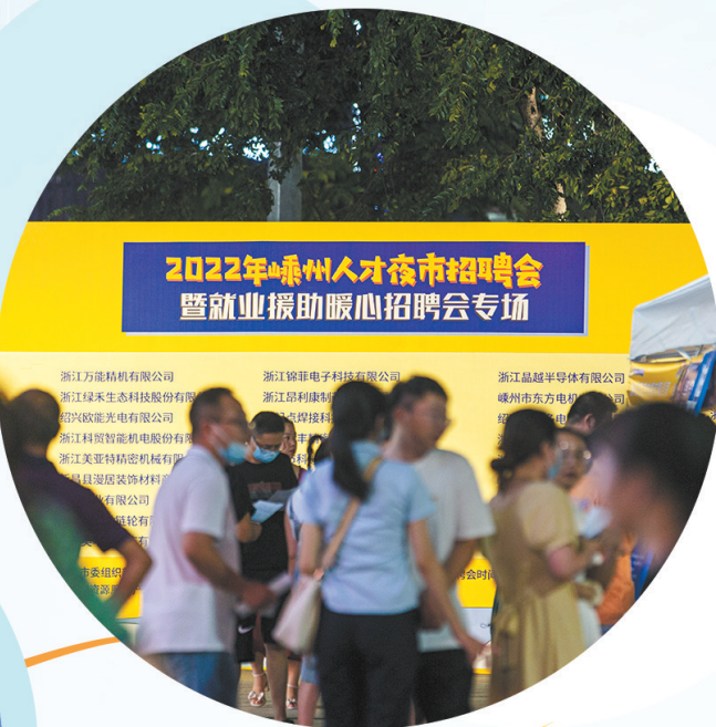
2022年嵊州人才夜市招聘会暨就业援助暖心招聘会专场