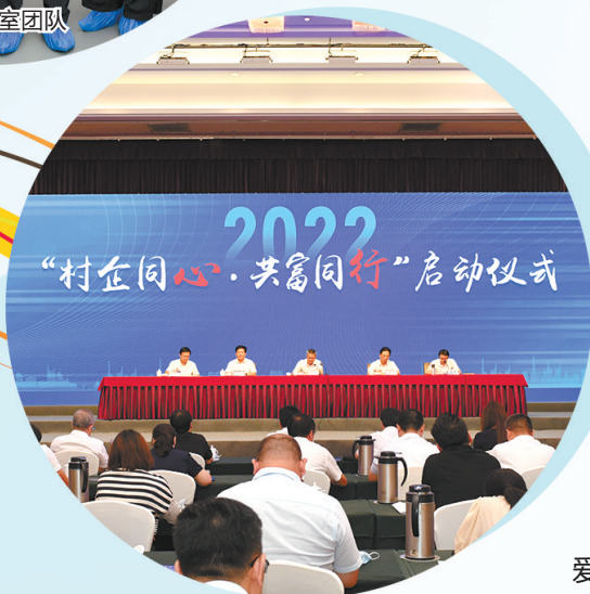
2022“村企同心·共富同行”启动仪式

四方为山,日嵊;八方来才,成州。嵊州,自古以来人杰地灵、人才辈出,是名士之乡绍兴的精彩篇章。