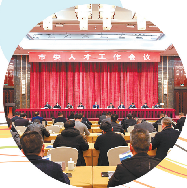
市委人才工作会议