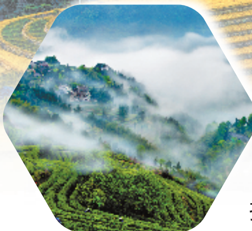
云雾缭绕的文成贡茶茶园

迈入新征程,宏伟蓝图鼓舞人心,声声号角催人奋进。在乡村振兴的进程中,文成力争走出一条绿色发展、强村富民的特色农业路,奏响农业绿色发展进行曲。