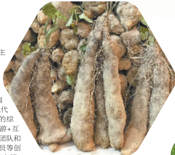
文成特产——糯米山药

不断优化平台建设,为文成农业发展注入生机活力。文成成立了“浙江大学文成大健康产业联合研究中心”,致力于创建集食品科学与工程、农业工程、现代物流保鲜和农业科学等多学科交叉融合的“协同创新”研发平台,助力文成成为国际领先的大健康产业技术高地,目前已投入1800万元用于科研