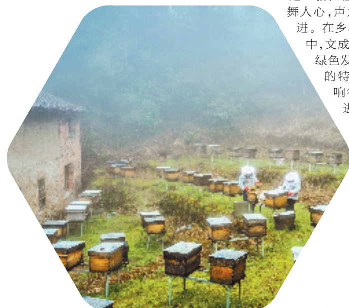
中蜂养殖在文成蓬勃发展

当前,文成已逐步形成品类丰富的农业发展格局。聚焦产业兴旺,当地以项目招引和特色产业示范带为抓手,高质量推进农业发展,打造农业全产业链。