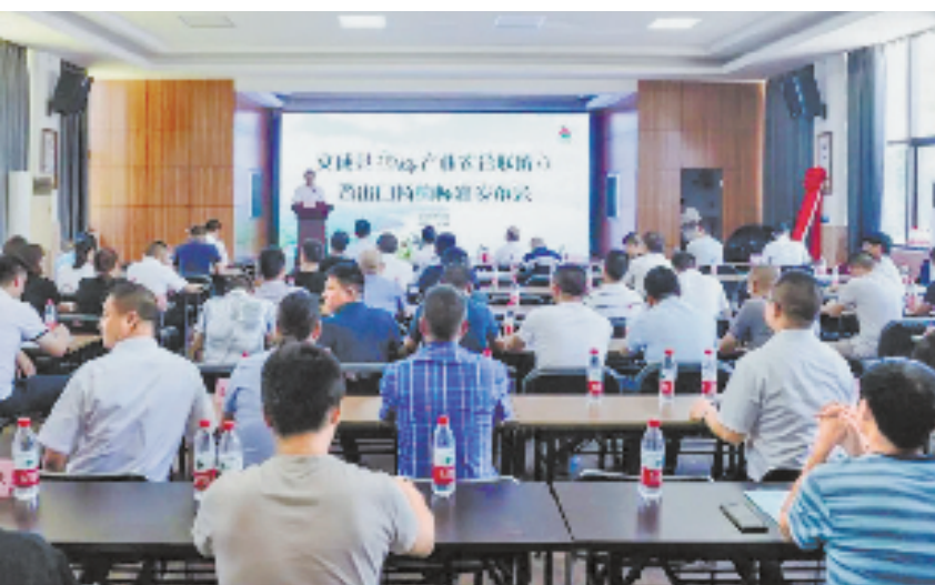
文成出口杨梅标准发布会