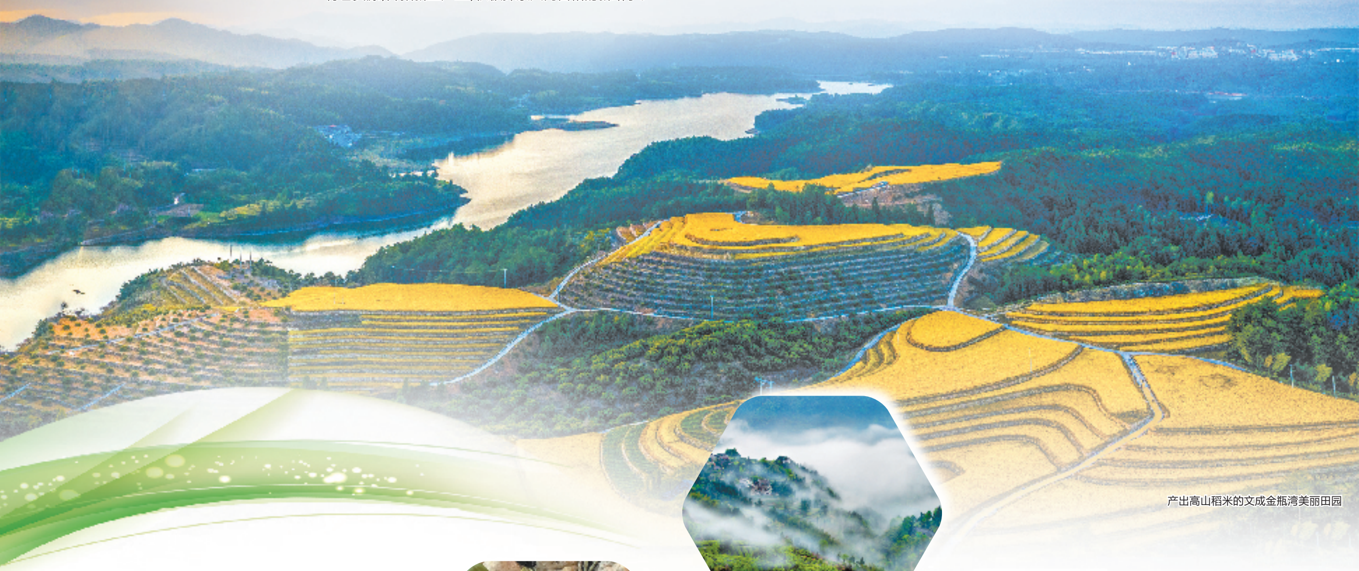
产出高山稻米的文成金瓶湾美丽田园

时光仿佛善于魔法,既能春华秋实,也能让田野发生靓丽的变化。时值11月,千里沃野,晚稻已颗粒归仓,蔬菜、瓜果精品荟萃,现代化大棚、数字农业示范等新技术滋润沃野田畴……在“绿水青山就是金山银山”理念指引下,文成的新型农业现代化道路越走越坚定、越走越宽广。山连山,水连水。漫步在文成,扑面而来的绿意,让人心旷神怡。“八山一水一分田”是当地的自然禀赋,当地村民深挖特色资源,开拓新型产业,积极探索共同富裕的新路子。