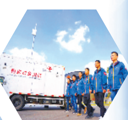
九年如一浙江联通守护世界 互联网大会优质通信与网络安全

中国联通落实国家战略部署,发挥数字技术对经济发展的放大、叠加和倍增作用,推进创新链、产业链、价值链融合发展,以新应用、新模式、新业态助力经济社会各领域数字化转型。作为中国通信行业领军者之一,浙江联通致力于成为5G时代数字信息基础设施运营服务国家队、网络强国数字中国智慧社会建设主力军和数字技术融合创新排头兵,持续深耕共建网络空间命运共同体,携手创造人类更加美好的未来。